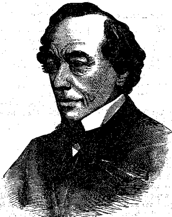
Ὁ Κύριος ΒΗΚΟΝΣΦΗΛΔ, ἀντιπρόσωπος τῆς Ἀγγλίας παρὰ τῷ ἐν Βερολίνῳ Συνεδρίῳ.

ΜΕΤΑΞΥ Ἀγγλίας καὶ Ἰσπανίας ποτὲ ναυμαχίαι συχναὶ ἐγίνοντο καθ' ἃς οἱ Ἀγγλοὶ ἐξήσκούοντο εἰς τὴν θάλασσαν, μεγάλη δὲ ἐτρεῖτο μεταξὺ τῶν δύο