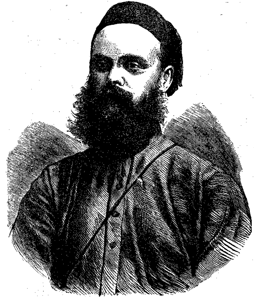
Ὁ Βαρῶνος VON DEN DECKEN.

ΤΥΧΟΝΤΕΣ πρό τινος χρόνου ἐν τῇ διευθύνσει τῆς