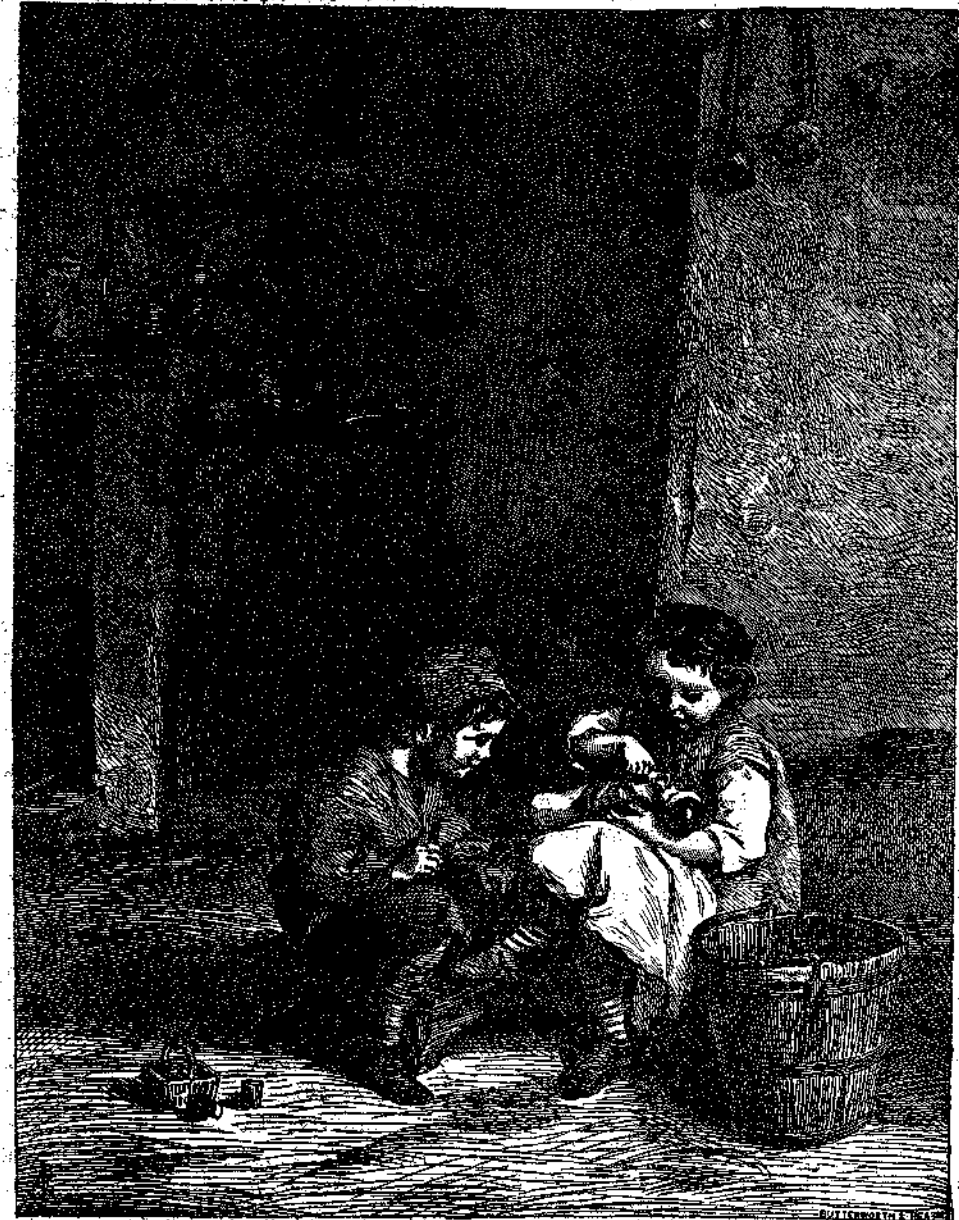
Ἡ ΕΛΕΝΗ ΚΑΙ Ο ΓΙΑΝΝΗΣ

Παίζανε δυὸ ὄρας τόσα τὰ ἀθῶο παιγνιδάκι, Ἐγέλασαν ὀλίγο, ἐτραγουδῆσαν σιγὰ Κ' ὕστερα τὸ μάθημά τους ὁ τὸ μικρὸ τους τραπέζακι Ἄρχισαν γιὰ νὰ μαθαίνουν σὺν τὰ φρόνιμα παιδιά. Εἶχαν ὄρα ὀρισμένη γιὰ παίγνιδι γιὰ σχολεῖθ Πότε δὲ ἄναν ἐκείνο, πότε δ' ἀρχίζαν αὐτό.