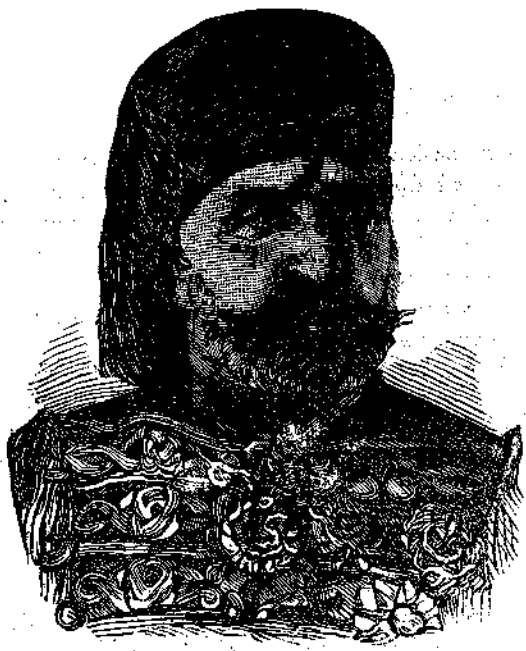
Ο ΒΕΗΣ ΤΗΣ ΤΥΝΙΑΟΣ

ὅτι τὴν 12 ἑκατονταετηρίδα μετὰ Χριστὸν εἶχεν εἰσαχθῆ ἢ χρῆσις αὐτῶν ἐν ταῖς οἰκίαις καὶ θεωρεῖτο μάλιστα ὡς πολυτελείας ἐπιπλον ἐν Ἀγγλίᾳ. Ἡ ὑφανσις μαλλίνων ταπήσων, μετενεχθεῖσα ἐκ Περσίας, εἰσήχθη ἐν Γαλλίᾳ ἐπὶ τῆς βασιλείας Ἐρρίκου τοῦ Δ', τῷ 1610, ὅτε εἶχον μεγάλην τιμὴν οἱ περσικοὶ καὶ τουρκοὶ τάπητες. Ὁ ἐργαλεῖος ἢ ἄλλως καλουμένη Ὀλλανδικὴ ὑφαντικὴ μηχανὴ εἰσήχθη ἐν Λονδίῳ ἐξ Ὀλλανδίας τῷ 1678 περίπου, ἀλλ' ἔκτοτε ἐτροποποιήθη μεγάλως, ἐβελτιώθη καὶ τοιαύτην ἔλαβε κυκλοφορίαν καὶ ἀνάπτυξιν ἢ τοῦ τοιοῦτου εἶδους μηχανῆ, ὥστε ἐν τῇ μεγάλῃ Βρεττανίᾳ ὑπάρχουσι ἤδη 250,000 ὑφαντικαὶ μηχαναὶ διὰ τῶν χειρῶν κινούμεναι καὶ 73,000 μηχαναὶ τοιαῦται, αἵτινες κινούνται διὰ τοῦ ἀτμοῦ, ἑκάστη τῶν ὁποίων ὑφαίνει 22 πήχεις καθ' ἑκάστην. Αἱ διὰ τοῦ ἀτμοῦ ὁμοῦ αὐταὶ μηχαναὶ εἰσήχθησαν τῷ 1807.