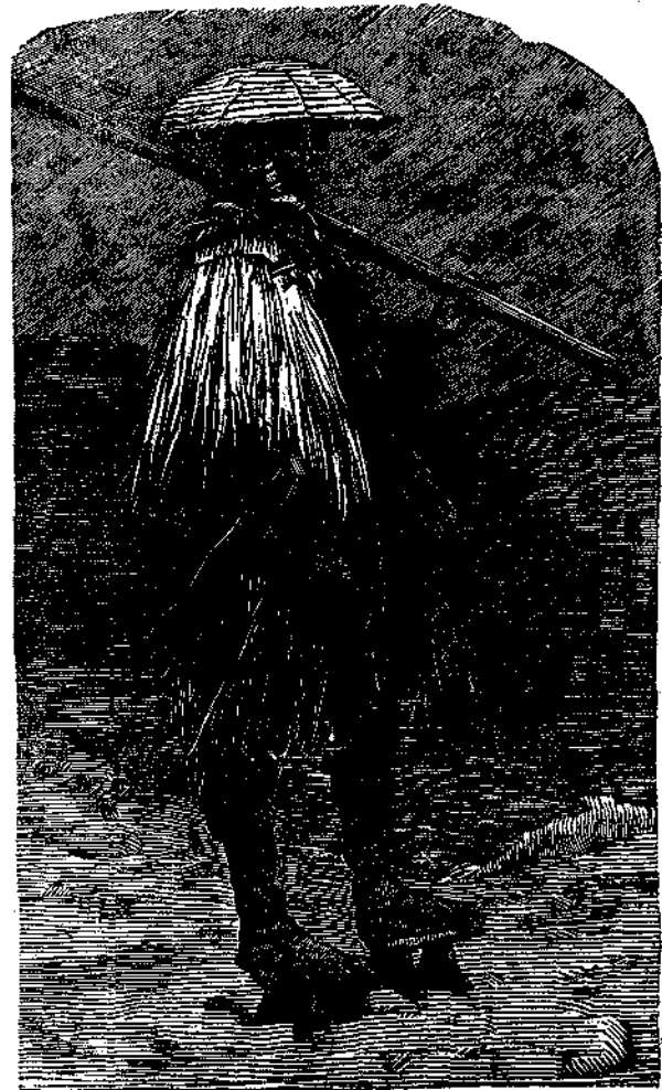
Κινεζὸς ἐργάτης ἐνδεδυμένος φύλλα καλάμης.

Ὁ κ. Γρίφιτ παρατηρεῖ ὅτι τὸ ἔργον τοῦ ἐκχριστιανισμοῦ τῆς Κίνας εἶναι εὐχερέστατον. Ἐν πόλει οἰκουμένην ὑφ' ἐνός, ἑκατομμυρίου ψυχῶν ἐδίδασκε τὸ