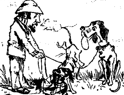
Σχολή και Βουλής