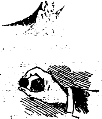
"Όπου Τρικούπης μαύρο