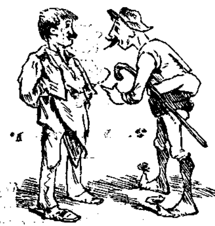
— Μαστρογιάννη εἰς κ' εἰς βάρδα ἀπὸ ὑπουργικοῦ. — Ἐμμένα τὸ λάς; Ἐγὼ τώρα θὰ βγάλω τὸ ἄχτι μου. Μὰς ῥήμαξαν τρία χρόνια.