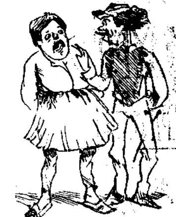
—Μιὰ ψῆφο θέλω, Μπαρμπαγαώργη —Γιὰ ποῖόν; —Γιὰ ἓνα Τρικουικὸ —Καλλίτερα νὰ μοῦ κοπῇ τὸ χέρι.