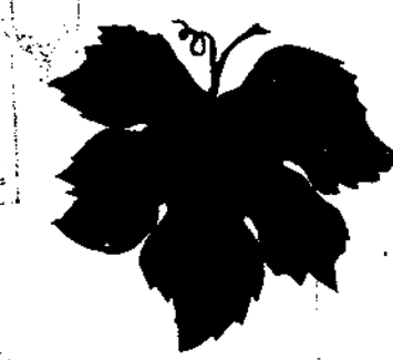
Σύμβολον ὑπουργικῆς αἰδοῦς