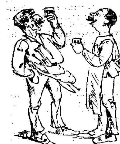
—Οἱ Τρικουικὸι ἔχουνε σημαδί κ' ἀρπαλέφυλλα. —Κ' ἐμεῖς τὸ κρασί. —Μαῦρο τοὺς λοιπὸν. —Πῆσα τους.