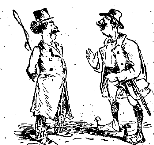
—Σεῖς γι καροτσαραῖοι προσοχῆ. —Μὲ σκοτόνεις, Μιστοκόλη! Γιατί μ' ἐπῆρες; Τὸ σινάφι ματ πάντα τὸ δαίς.