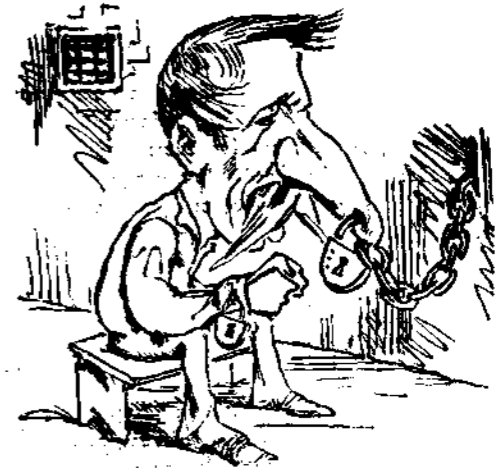
ΕΝ ΑΘΗΝΑΙΣ Κι' αὐτὸς παραμύσα!!