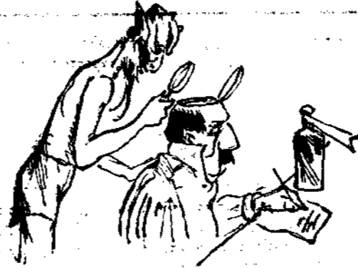
Δὲν πάσχει τοὺς πόδας