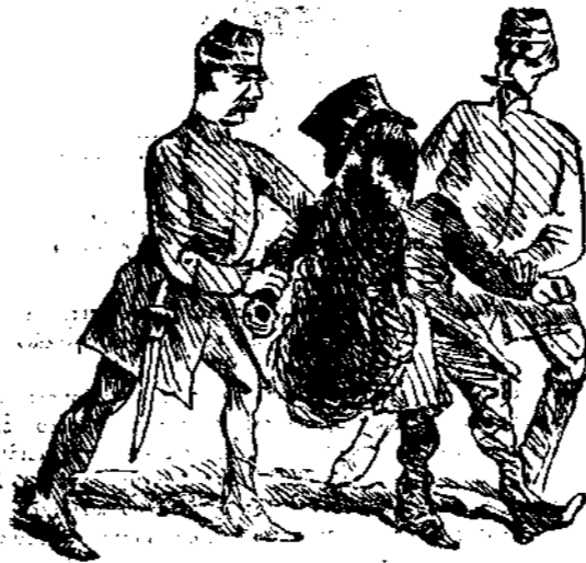
ΕΝ ΠΑΡΙΣΙΟΙΣ Μίσα!