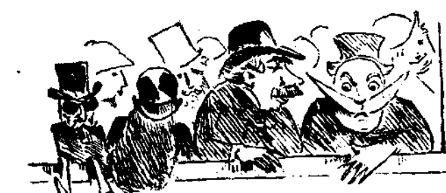
Θεωρείον εν τη Βουλῆ των καραβοτσακισμένων