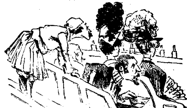
Τα δυσάρεστα του συριμού