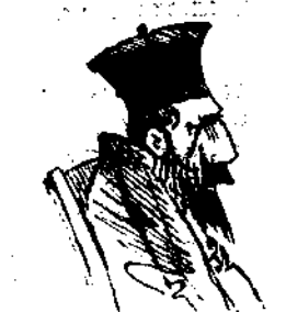
Incognito εν τη Βουλῆ