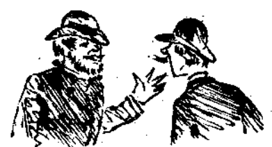
— Έλαμψε πάλιν εν τη Βουλῆ ο Τρικουπήσ δια της άπουσίας του. — Έκείνος αρκετά ειχε λάμψει δια του «Φάρου του Βοσπόρου».