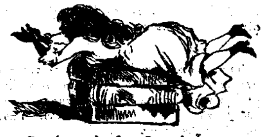
Γυμνάσια κολυμβητικῆς κατ' οἶκον.