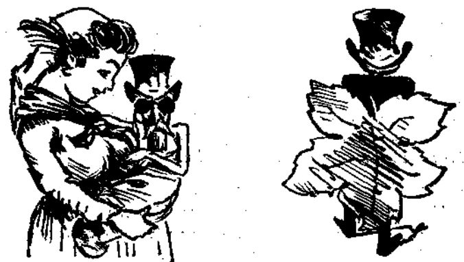
Ἄναγέννησις. Ἀπαράττητος ἰουμπασε