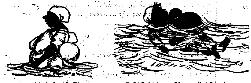
Αἰδ' νὰ ἐπιπλήσῃ Καὶ ἀνεῖ προσθέτων βοηθημάτων