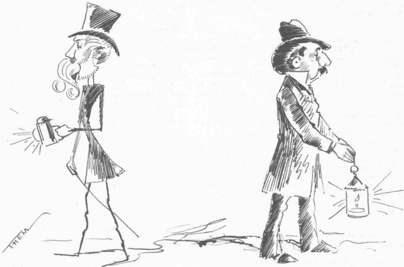
ΕΙΣ ΑΝΑΖΗΤΗΣΙΝ ΥΠΟΨΗΦΙΩΝ ΔΗΜΑΡΧΩΝ