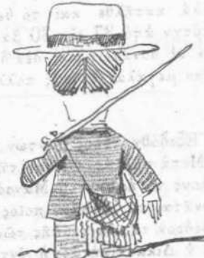
Χωρὶς τὸν Ντίκ