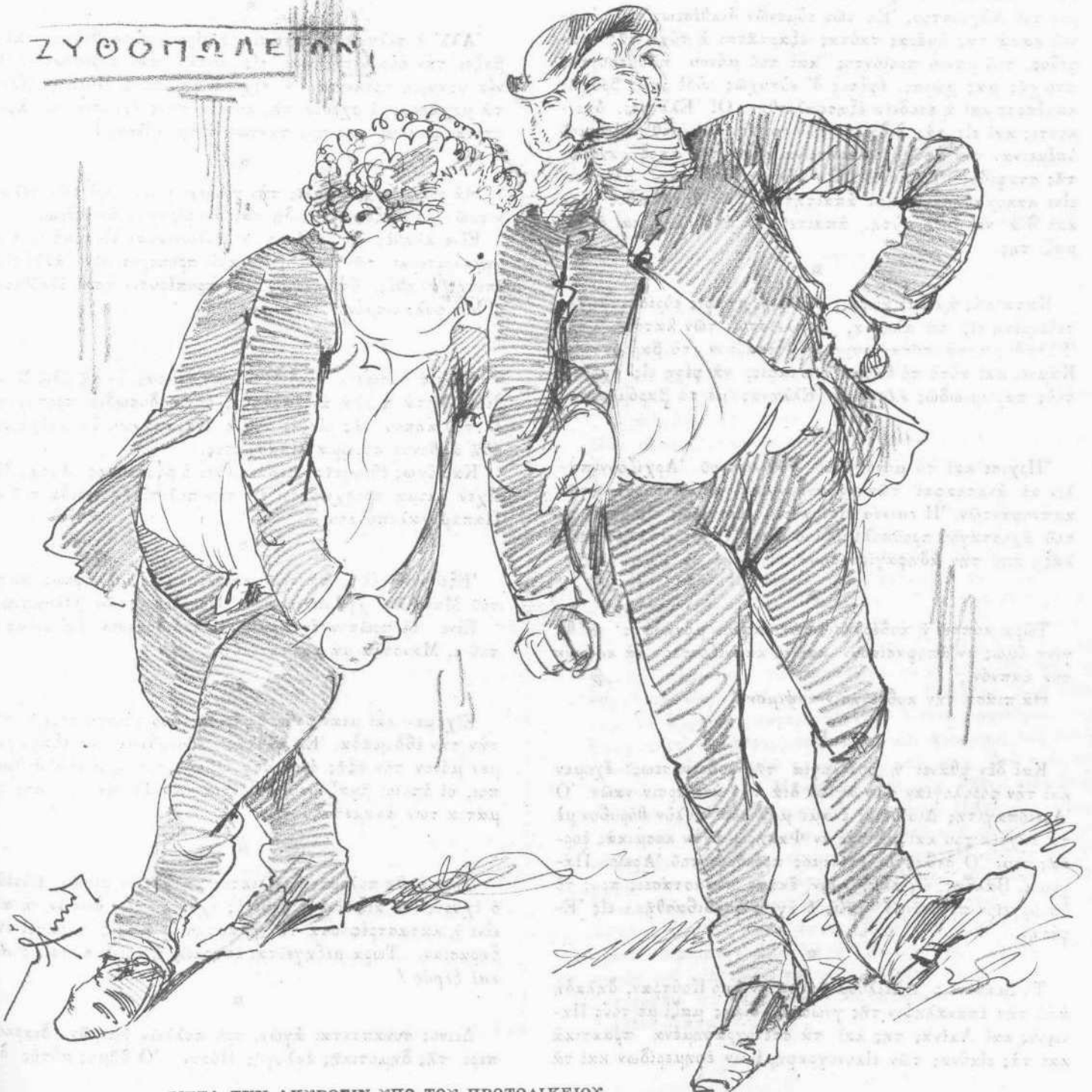
ΜΕΤΑ ΤΗΝ ΑΚΥΡΩΣΙΝ ΥΠΟ ΤΟΥ ΠΡΩΤΟΔΙΚΕΙΟΥ