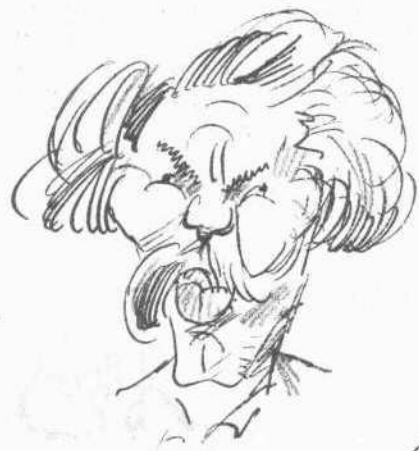
Ο ΚΑΠΕΤΑΝ ΑΝΔΡΕΑΣ