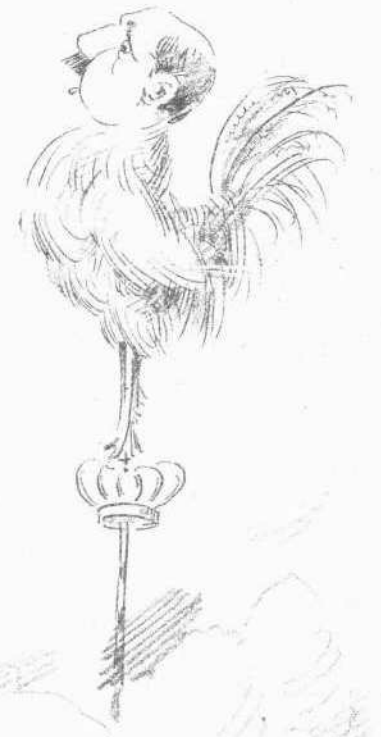
ΚΑΙ ΠΑΛΙΝ Ὅρα τὸν μῦθον τοῦ Αἰγῶπου