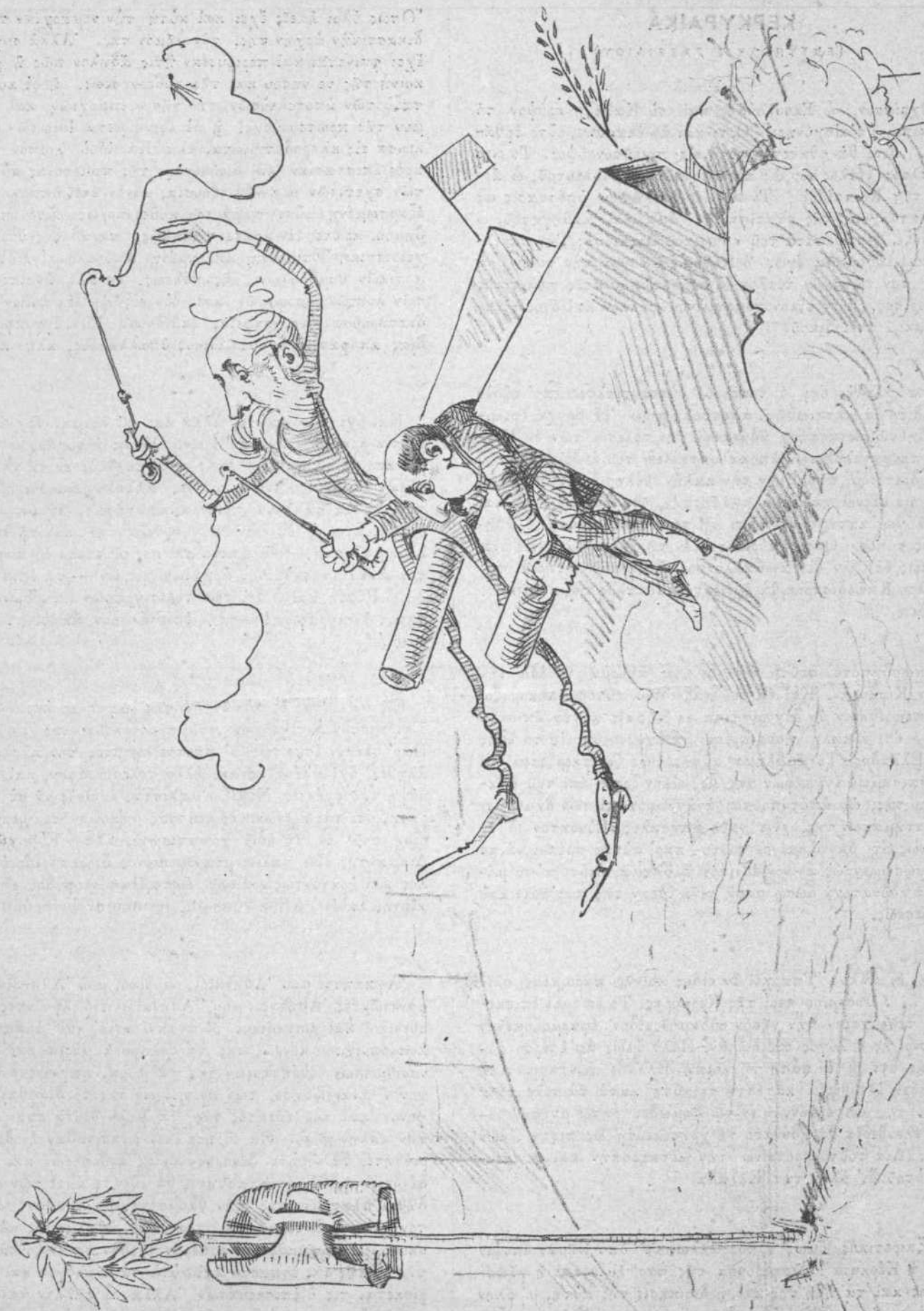
ΚΑΛΠΟΔΡΟΜΙΑΙ ΤΗΣ ΜΕΓΑΛΗΣ ΠΕΡΙΦΕΡΕΙΑΣ