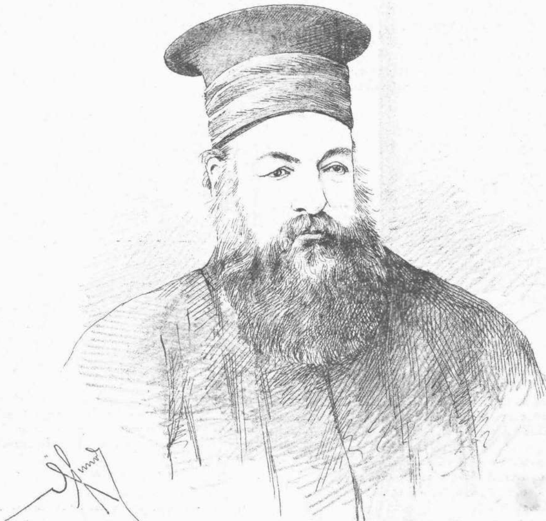
Ο ΝΕΟΣ ΟΙΚΟΥΜΕΝΙΚΟΣ ΠΑΤΡΙΑΡΧΗΣ ΔΙΟΝΥΣΙΟΣ