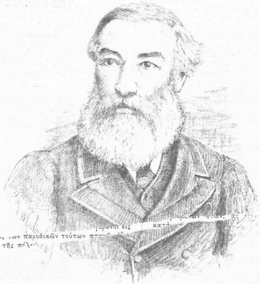
τους ούρακούς των παροδικών τούτων πτωχών 11 - ζνωθεν της πύλης