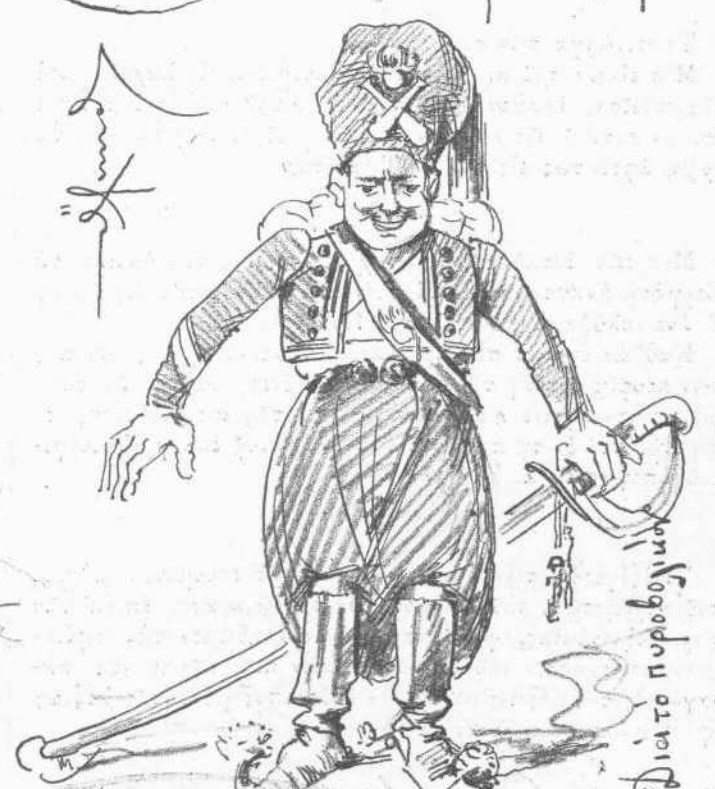
Υπ' όφιν της Α.Μ. και του κ. Πρωθυπουργού