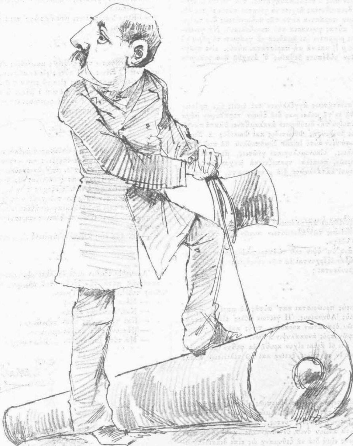
Ο ΑΛΗΘΗΣ ΚΑΝΟΝΙΕΡΗΣ THREE KRUPP