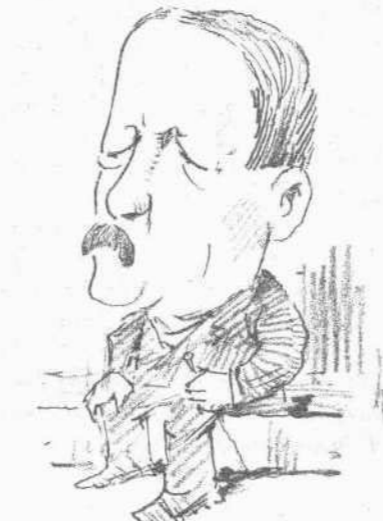
Μάρτυς τῶν συνεδριάσεων