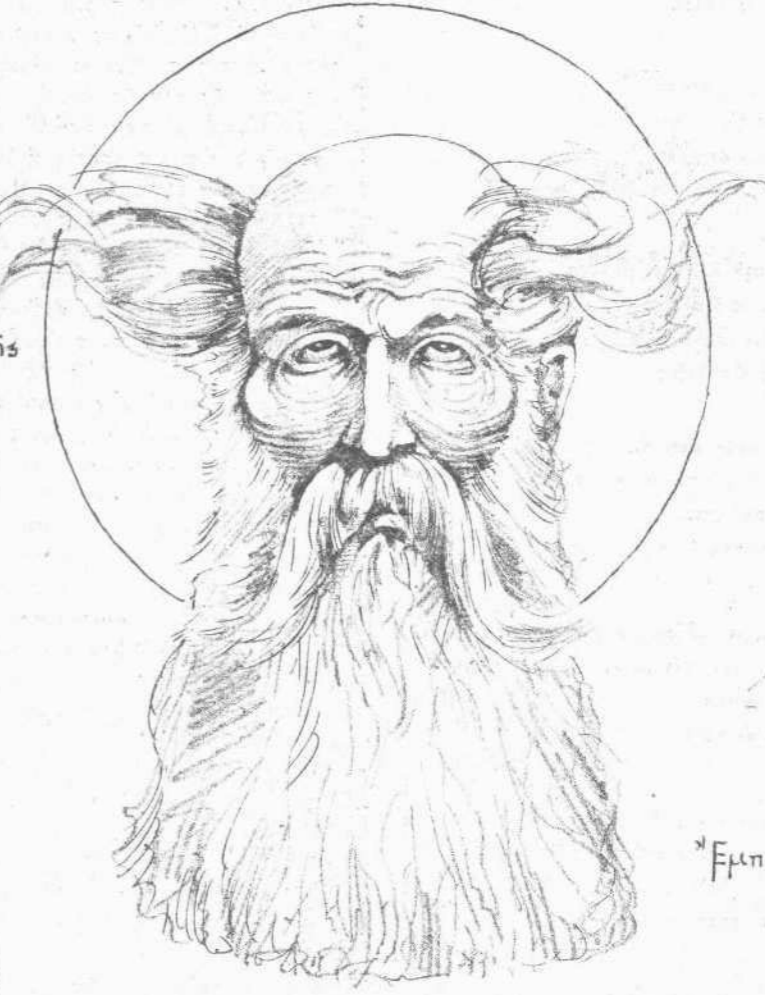
Πραυτιὰ τῆς βουχῆς τῆς 18 Μαρτίου