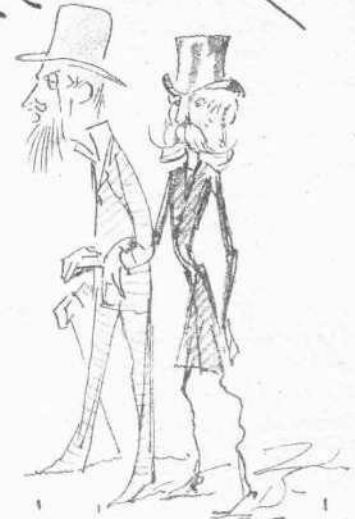
Θρατεί την προεχθη Τεταρτη

- Προς κατ'αίσθησιν των εν τη βουχη φροσερων λογων - Εξ' Αμερικης τα φωτα - Την καινη σου: Θ' Χειρην σθητη τα φωτα