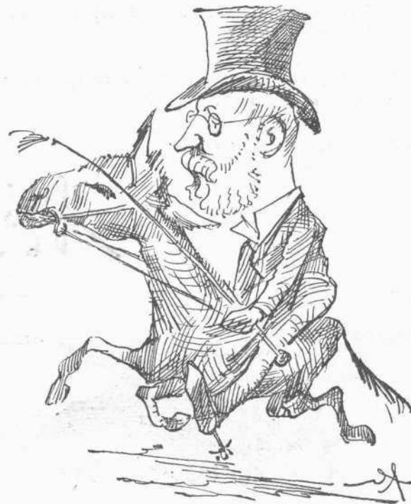
Ὁ ἱππότης Κούμπαρταλ