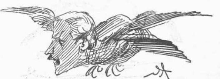
Εἰς ἀναζήτησιν λείας.