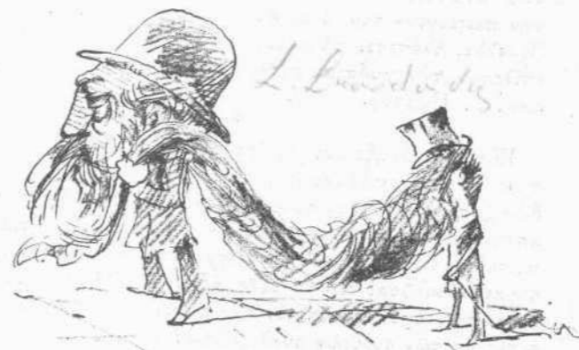
Εἰς ἀναζήτησιν ἀγοραστοῦ τῆς Κωπιδίος