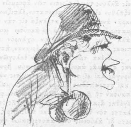
Οι βουχίται του σαρμού