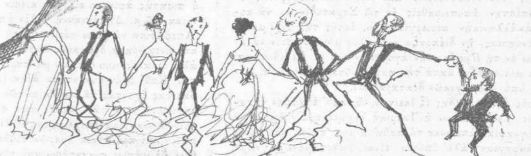
Ο σαρτός του σαρμού