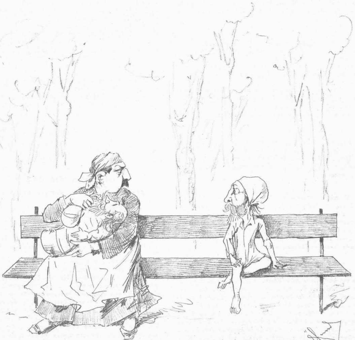
ΤΟ ΤΕΚΝΟΝ ΤΟΥ ΛΑΟΥ