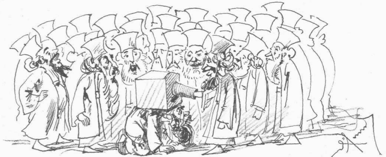
Μετὰ τὴν συμβουλὴν του Πάπα πρὸς τοὺς Ὀρθοδόξους ὁ Λάτς εἰσήγαγε εἰς τὸν κλῆρον τὴν καθολικὴν ψηφοφορίαν.