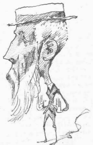
Διαμαρτύρεται ὅτι δὲν τῷ προσεφέρθη θέσις.