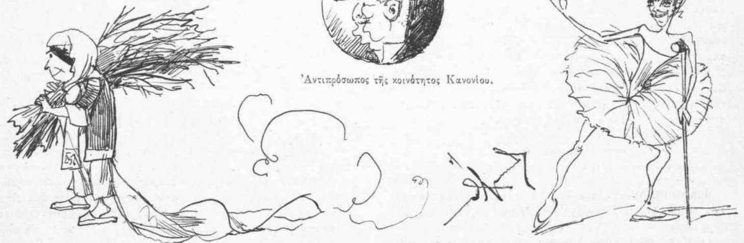
Ὁ συρμός τῆς οὐρᾶς καὶ εἰς τοὺς δρόμους.