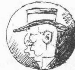
Ἀντιπρόσωπος τῆς κοινότητος Κανονίου.