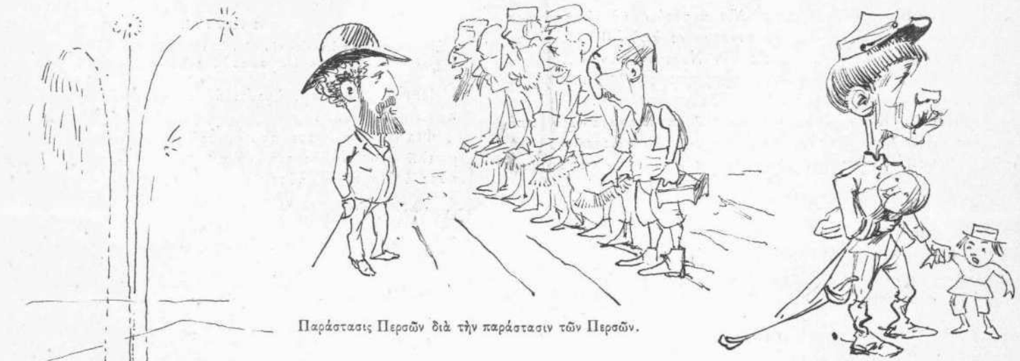
Παράστασις Περσῶν διὰ τὴν παράστασιν τῶν Περσῶν.