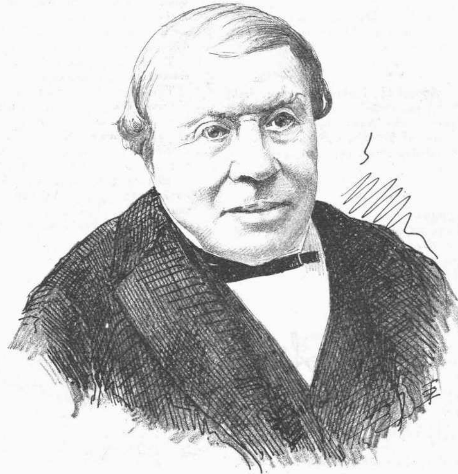
Ο ΙΑΤΡΟΣ RICORD

Υπάρχουσι τινες προσωπικότητες εξαιρετικῶς συμπαθεῖς. Τοιαύτη υπῆρξεν ἡ τοῦ ἐπισήμου ἱατροῦ Ricord, τοῦ ὁποίου ἡ φήμη ἀπὸ ἡμῶν σχεδὸν αἰῶνος ἐγένετο παγκόσμιος. Διότι ὁ ἐξοχος ἱατρός συνήνου τὴν ἐπιστήμην καὶ τὴν τέχνην μετὰ τῆς φιλάνθρωπίας καὶ μετὰ τῆς συμπαθοῦς ἐκείνης ἰλαρότητος, ἣτις τόσον παρηγορεῖ τοὺς ἀρρώστους.