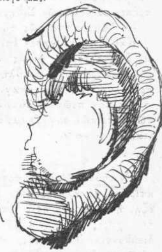
Τή διευθύνον τή θεάτρον αυτί.

— Τι πληξίς τή θεάτρον έφίτος. — Δέν έτρώγαμε καλλίτερα στραγάλια τά χρήματά μας.