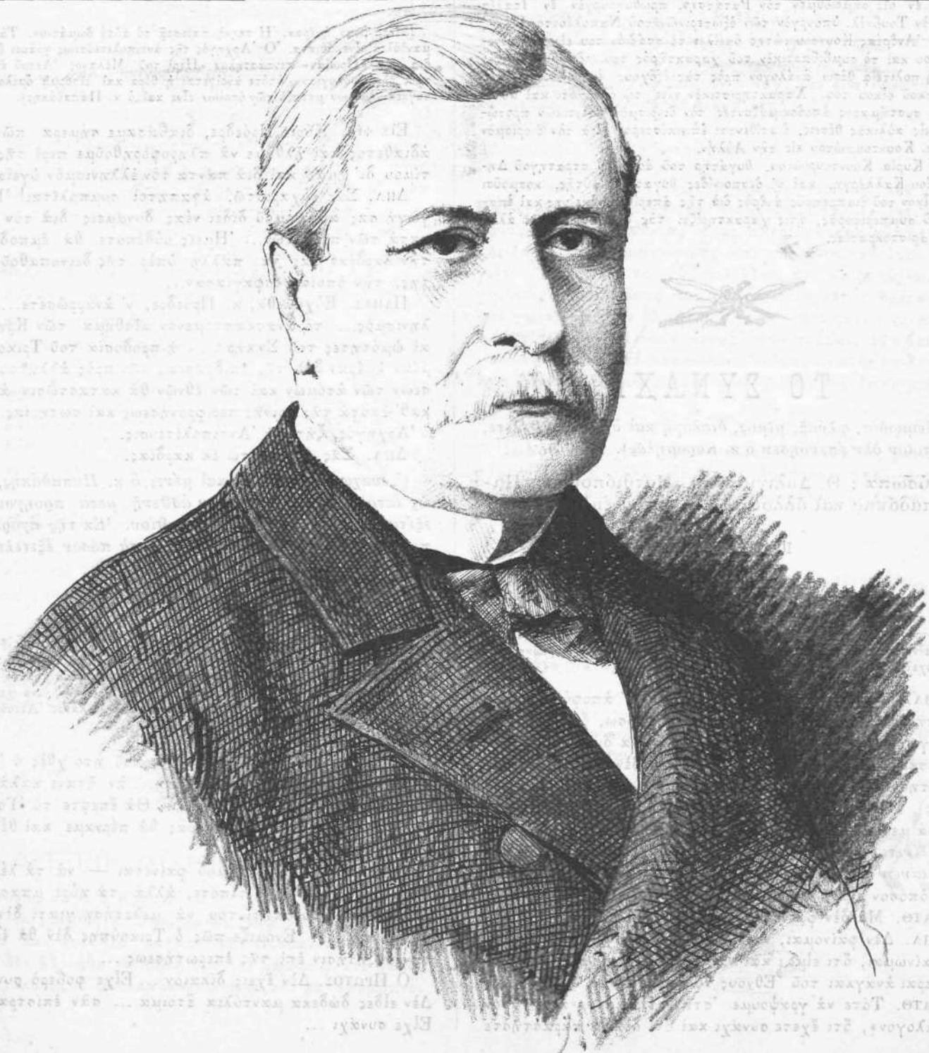
Ο ΜΕΓΑΣ ΑΥΛΑΡΧΗΣ ΑΝΔΡΕΑΣ ΚΟΥΝΤΟΥΡΙΩΤΗΣ