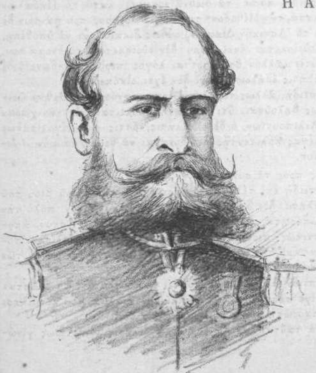
Ο ΣΤΡΑΤΗΓΟΣ ΦΟΝΣΕΚΑΣ (Ἀρχηγὸς τῆς ἐπανάστασης).