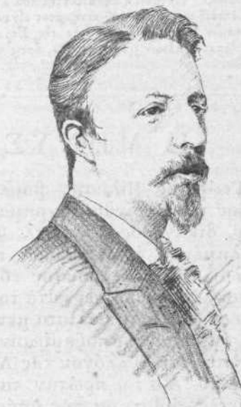
Ο ΚΟΜΗΣ Δ' Ε