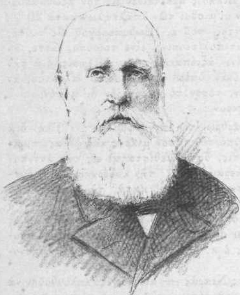
Ο ΑΥΤΟΚΡΑΤΩΡ ΔΟΝ ΠΕΤΡΟΣ