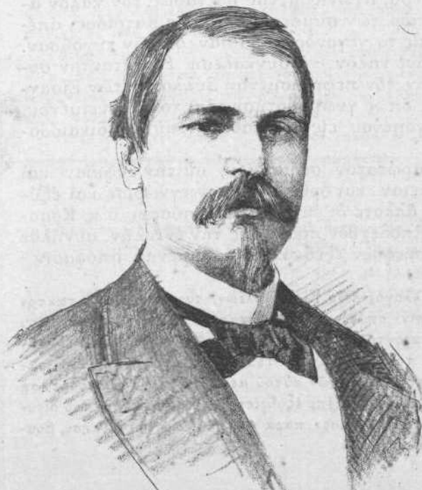
ΒΕΝΙΑΜΙΝ ΚΟΝΣΤΑΝ (Ἵπουργὸς τῶν Στρατιωτικῶν).