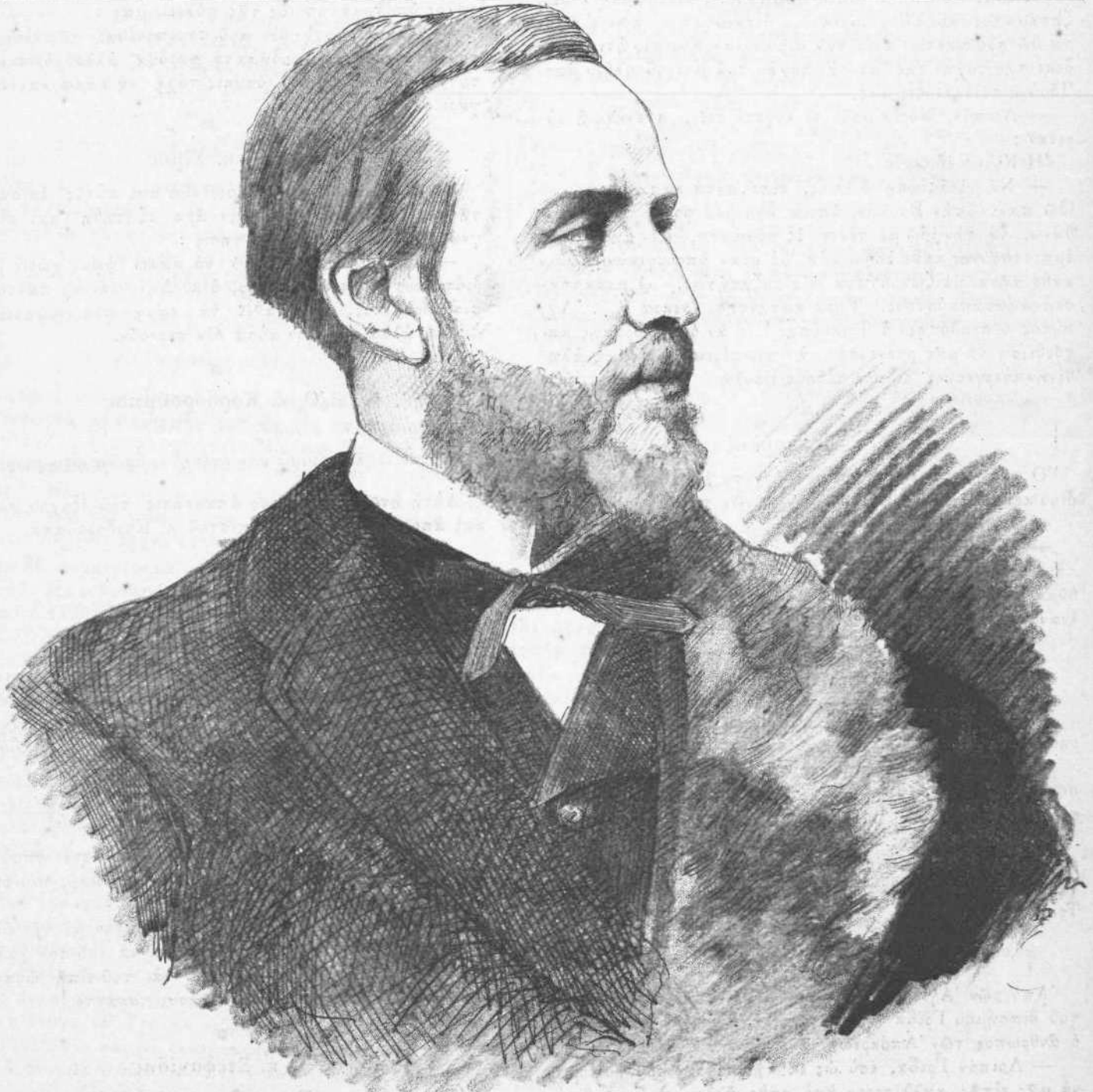
Ο ΜΑΡΚΗΣΙΟΣ DE QUEUX DE SAINT - HILAIRE