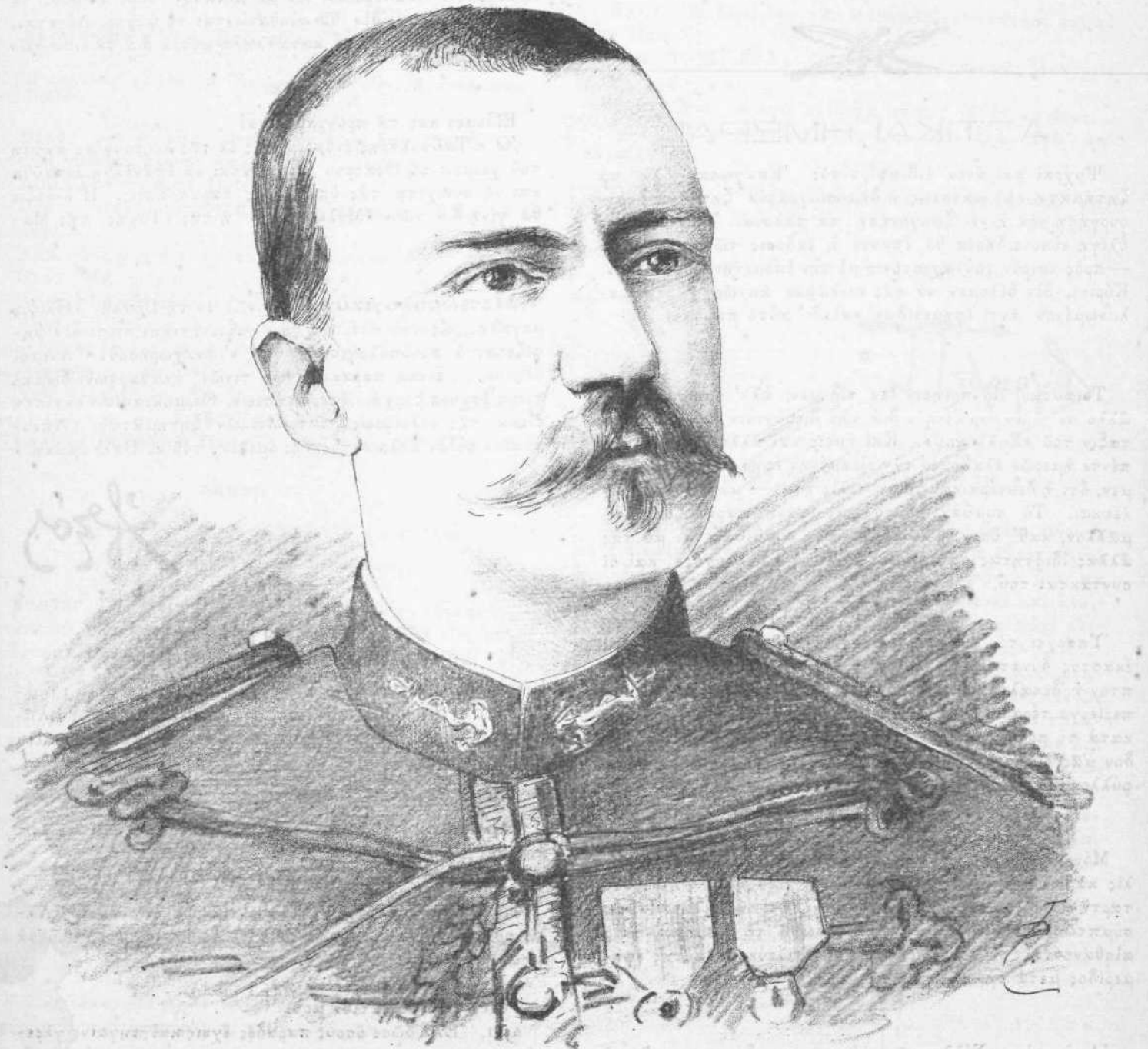
Ὁ γάλλος ἐρευνητὴς τῆς Ἀφρικῆς BINGER.