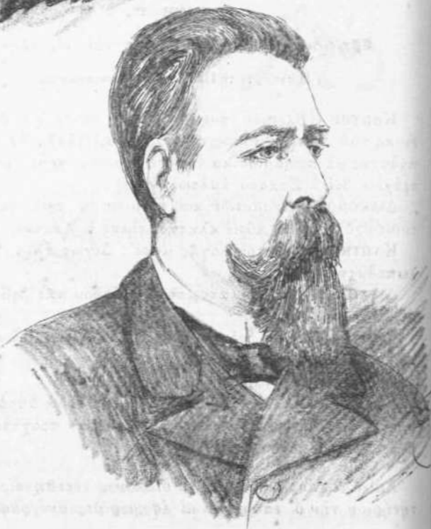
Ἡ ἐπανάστασις τῆς Βραζιλίας.

1) Da Silveiro Lobo, (ὑπουργὸς τῶν Ἐσωτερικῶν).— 2) Demetrio Ribeiro, (ὑπουργὸς τῆς Γεωργίας).— 3) Eduard Uandenkolk, (ὑπουργὸς τῶν Ναυτικῶν).— 4) Campos Salles, (ὑπουργὸς τῆς Δικαιοσύνης).— *Ἡ νέα σημαία τῆς δημοκρατίας.