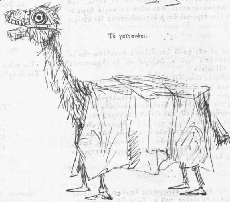
Τελειοποίησις τῆς Καμήλας.