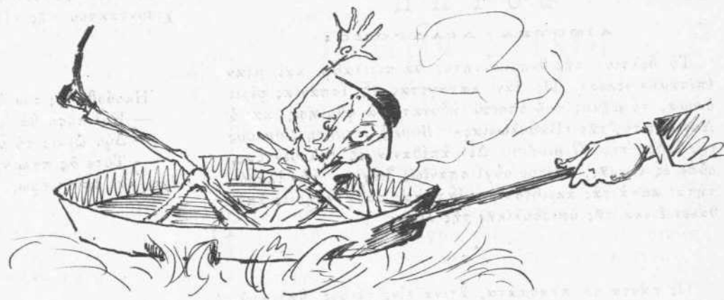
Πῶς τὸν ἐτσιτίρισαν.