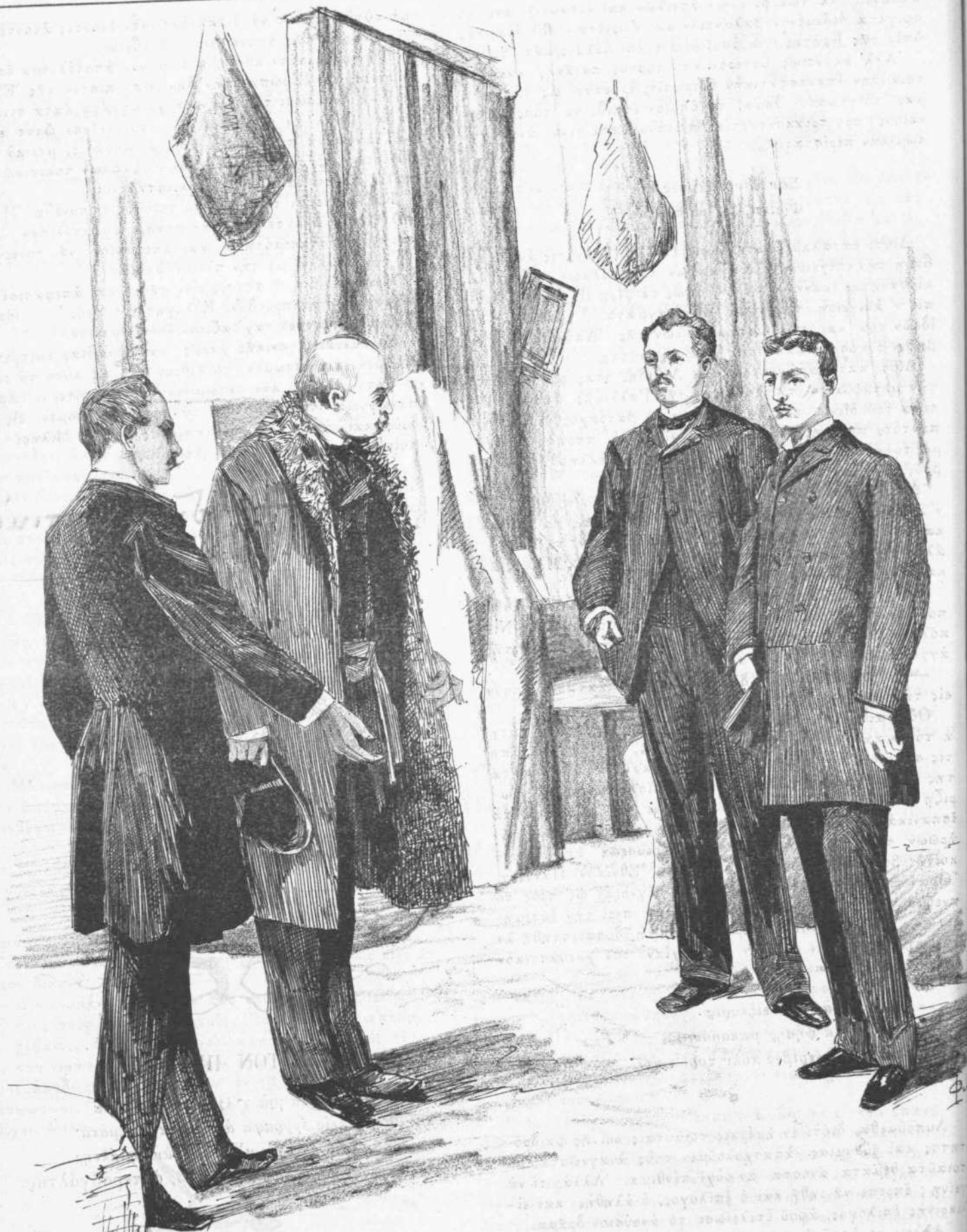
Ἡ σύλληψις τοῦ Δουκὸς τοῦ Ὁρλεάνς.