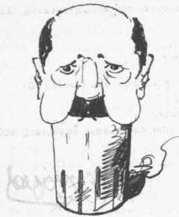
Ἐπεπληρώθη τὸ ποτήριον!!!