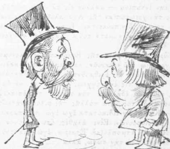
— Τί ξεύρετεν περὶ τῆς ἐκλείψεως τοῦ ἡλίου. — Ἡλίου φαινώτερον, ὅτι θὰ ἔχωμεν ἐκλογὰς.