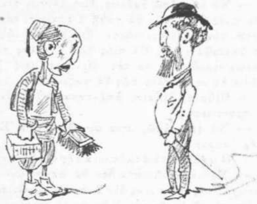
— Περσικαὶ προτάσεις διὰ τὸ γυάλισμα τῶν ὁδῶν εἰς ἀντίπραξιν τοῦ Φάμπρ.