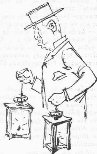
Εἰς ἀναζήτησιν τοῦ Κουρτζῆ.