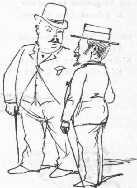
— Μήπως γνωρίζεις καὶ δι' ἐμὲ καμμία θέσι; — Εἶνε μία. Ἡ διοίκησις τῆς Ἐθν. Τραπεζῆς.