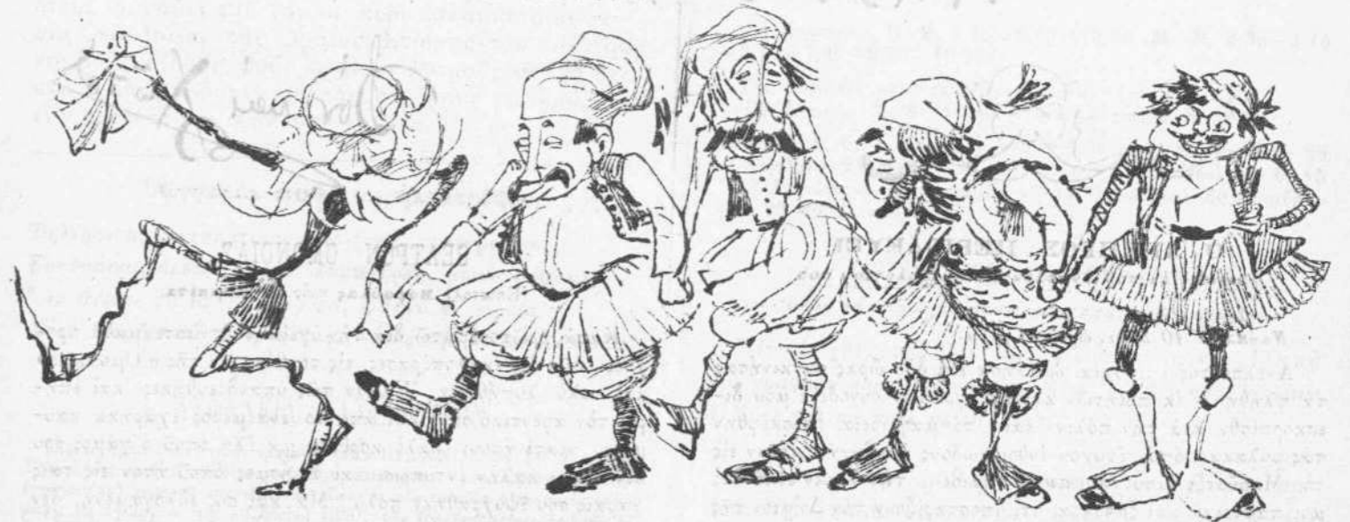
Ὁ Γεγέτης τῆς ἀντιπολιτεύσεως καὶ τοῦ συρτοῦ.