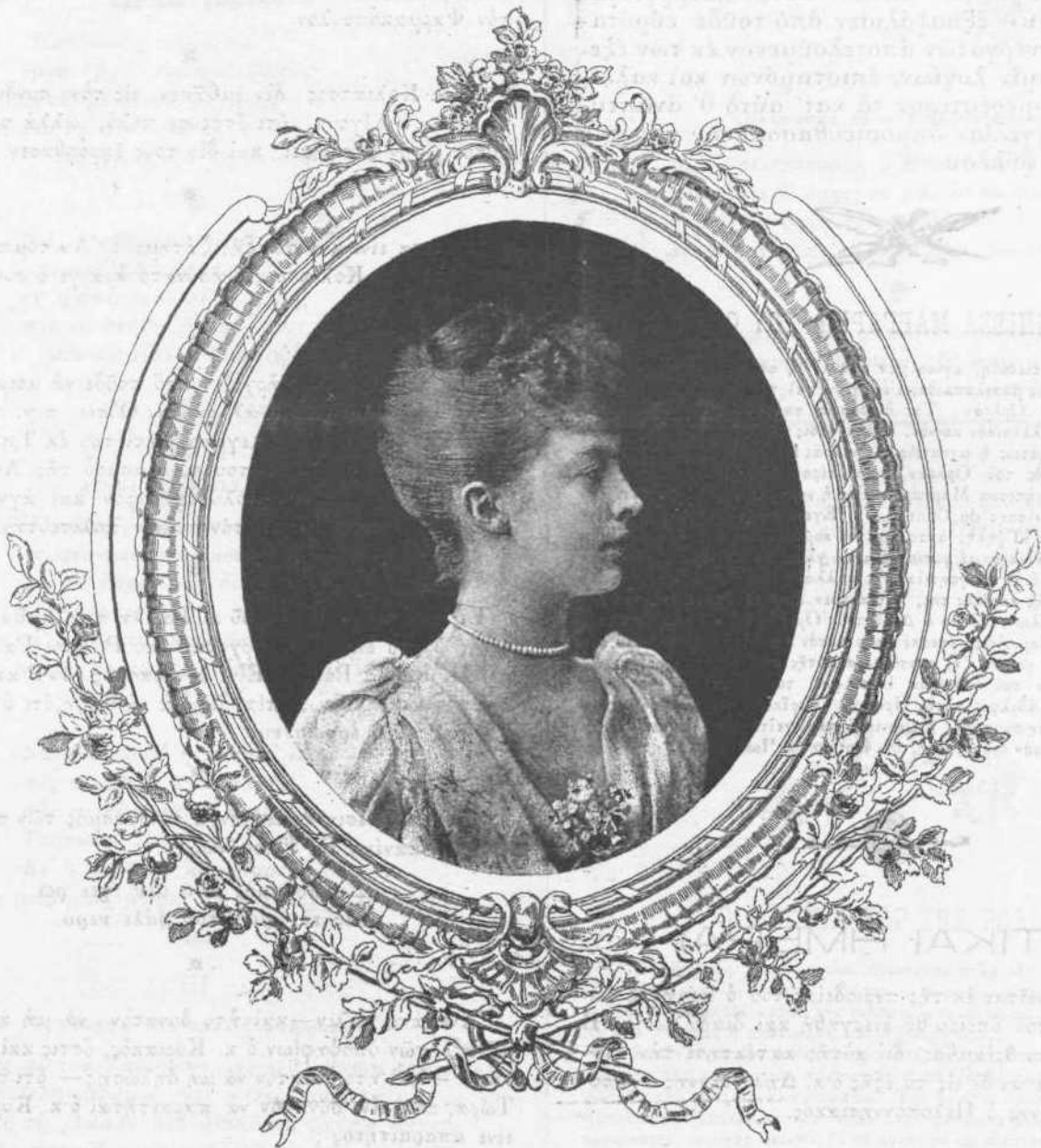
Η ΠΡΙΓΚΗΠΙΣΣΑ ΜΑΡΓΑΡΙΤΑ ΤΟΥ ΟΡΛΕΑΝ