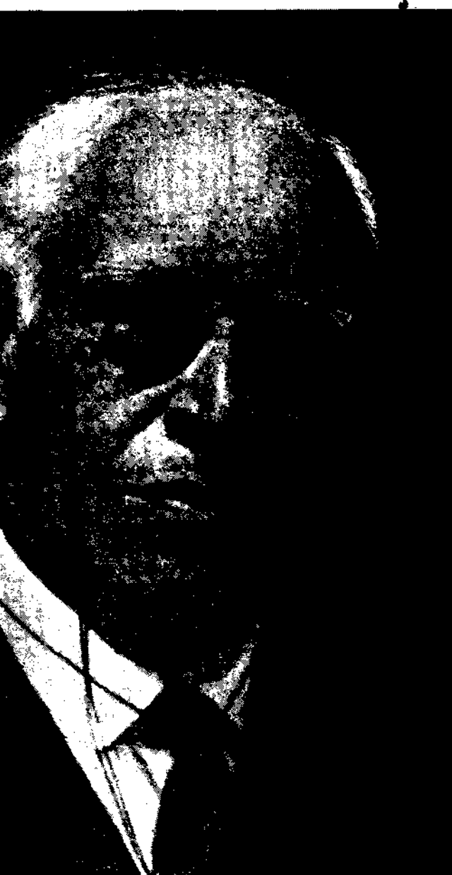
Ὁ Στανιολάσκι τὸ 1933.

τὰ περίφημα εἰκονογραφημένα καὶ τὰ ἄλλα κακοτυπωμένα ἔβδομαδιαία περιοδικὰ διασκέδασαν τὴν ἀνία τους μὲ τὶς ρομαντικὲς περιπέτειες τῆς φτωχούλας πού γίνεκε star καὶ πού παίρνει τώρα τὴ βδομάδα ἓνα μισθὸ ἀπὸ τὸς δολάρια καὶ τὸς μνηδικὰ πού σοῦρεχεται ζάλη—κι ὕστερα ἡ γοητεία τῶν ζέν πρεμιέ κι οἱ θρυλικὲς πολυτέλειες καὶ οἱ ἐκκεντρικότητες τῶν φταγμένων... φυσικὰ καὶ τὰ κουτσομπολιὰ τῶν δικῶν μας παρασκήνιων καὶ μερικὰ ἀναμασημένα, γουστὸζικὰ τάχα ἀνε-