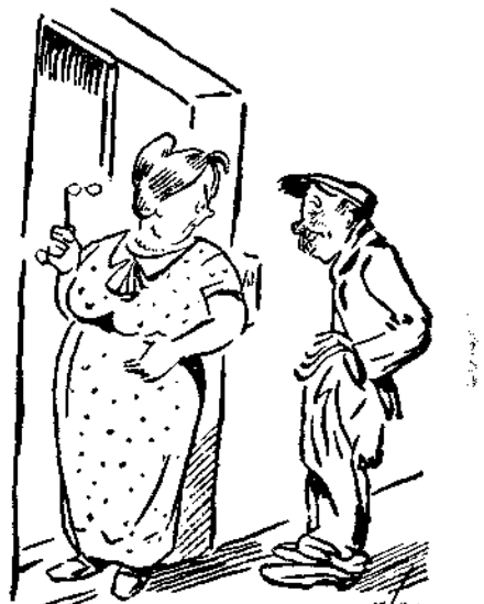
— Βγάλε τουλάχιστο τα χέρια σου από τις τσέπες, αφού ήρθες να ζητιανέησ!