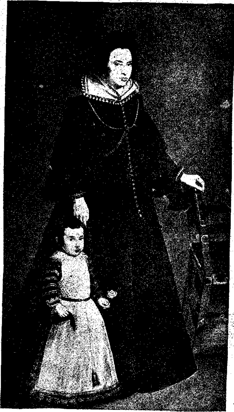
ΒΕΛΑΖΚΕΖ : «Πορτραίτο». Μουσείο του Πράδο.