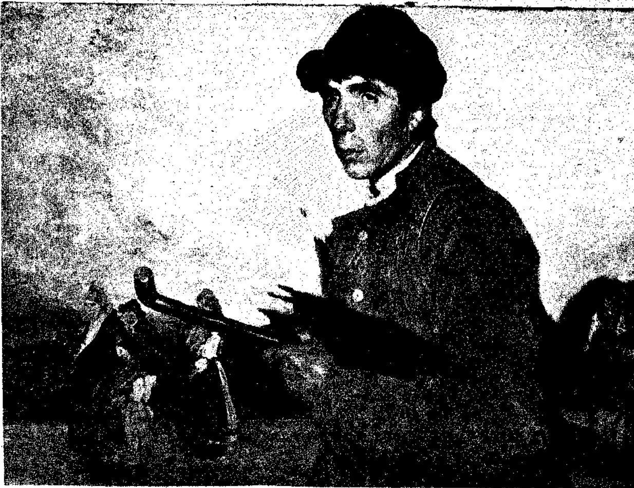
ΦΕΡΝΑΝΤΟ ΑΛΒΑΡΕΘ ΝΤΕ ΣΟΤΟΜΑΓ ΙΟΡ : «Πηγαίνοντας στο παζάρι». Ο Σοτ ομαγέρ γεννήθηκε στα 1875 και χρημάτισε διευθυντής του Μουσείου του Πράδο στη Μαδρίτη.

Μιά όμως κι άρχισαμε εύτραπελα, άς τελειώσουμε κάπως σοβαρά. Ο συναδέλφος της άντικρινής στήλης, έλεγε πως ή φρίκη της ζωής είναι ένα προπατορικό άμάρτημα. Διαφωνώ μαζί του... Οι πρόγονοί μας μέσα στις σπηλιές τους δέν γνώρισαν ποτέ την κόλαση μιάς Σογ-