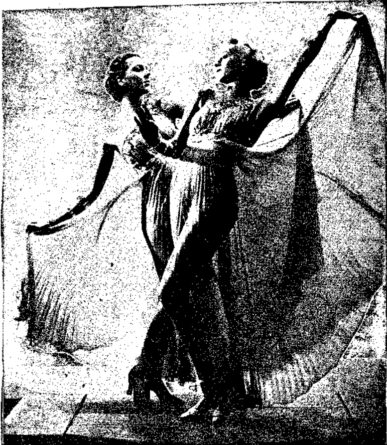
Δύο από τις Μέρριες Άιμπος Γκέαρλς όπως χορεύουν στο μπαλέτο «Σοφία» στ ό Λονδίνο.