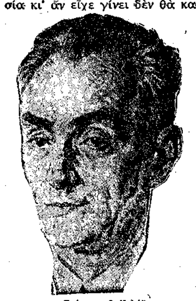
Σκίτσο του Μιλώδ.