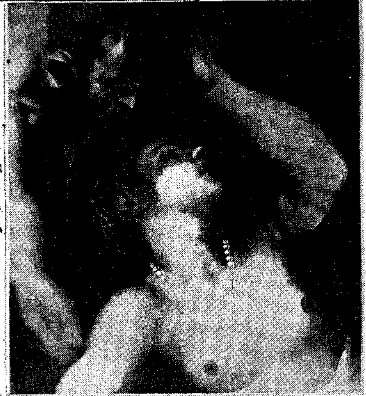
Επάνω : ΤΙΝΤΟΡΕΤΤΟ : «Ταρκίνος και Λουκρητία», που ανακαλύφθηκε πυλωτα στη Γαλλία. Κάτω : λεπτομέρεια από τον ίδιο πίνακα.