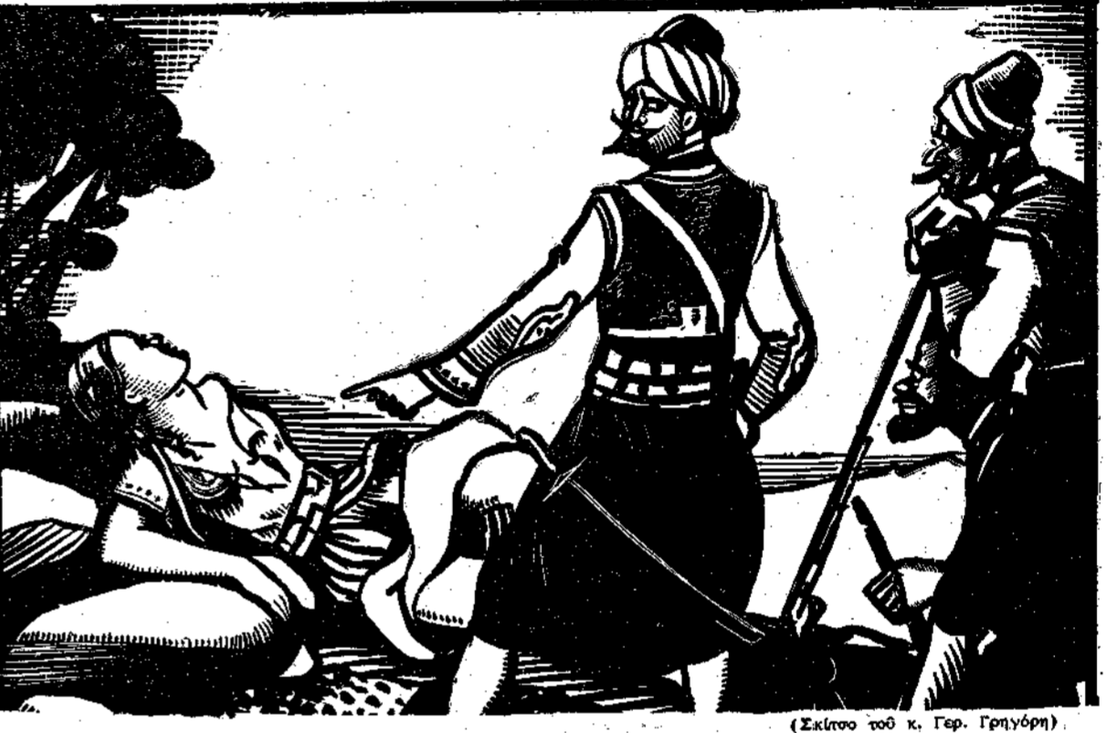
(Έκδοση του κ. Γερ. Γρηγορίου)

«Κι έσθ σου τήν πώ, μωύ λέει. Εφάντασμα τόν έρωτά σου...»