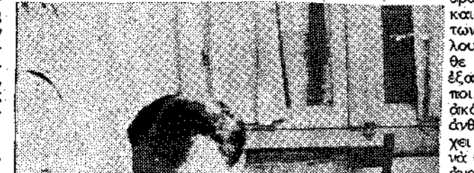
Ο ΙΟΥΛΙΟΣ ΒΕΡΝ Κ' Η ΝΟΣΤΑΛΓΙΑ ΤΗΣ ΑΤΤΙΚΗΣ