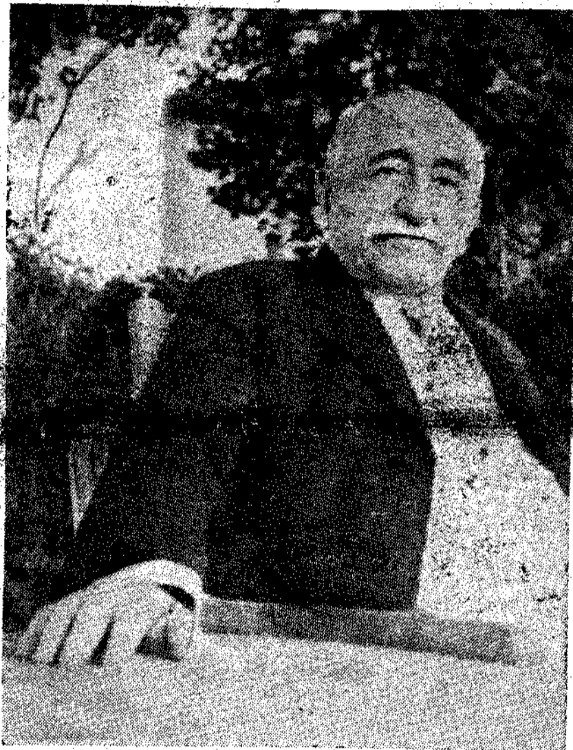
«Τό χέρι τού Δασκάλου» όπως δέχτηκε νά ονομαστει από ή φωτογραφία.

νά σας πιστέψη. Τού κάκου γράφετε γραμματικές τής κ α θ ω μ ι λ η μ ε ν η ς και βάζετε μέσα όλη τήν άρχαία γραμματική, περιττούλλαβα, ύπερσυντέλικους και μετοχές, ύστερα μάλι-