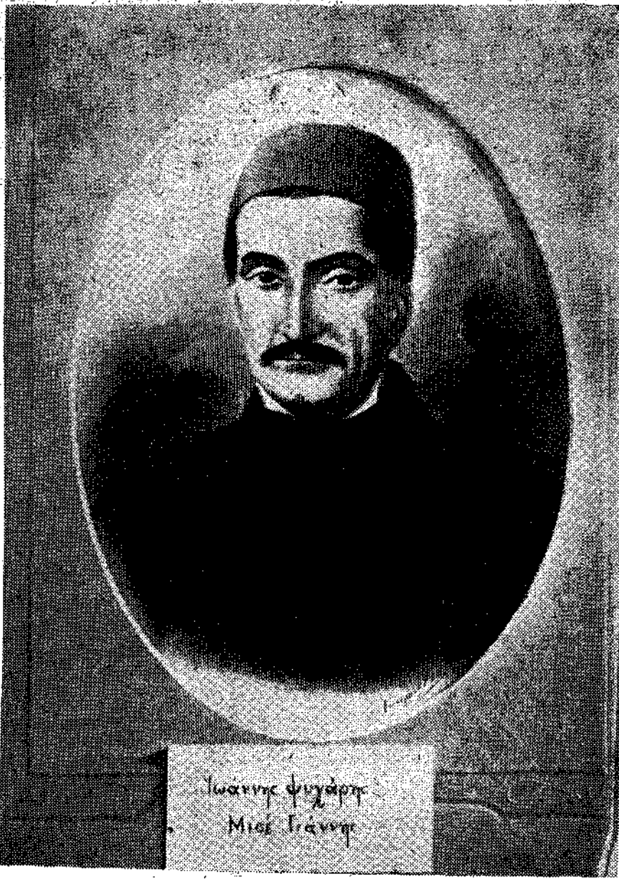
Ιωάννης Ψυχάρης Μισι Γιάννης

Το ότι όμως υπήρχαν και ζωντανές δυνάμεις που γύρευαν να προπεράσουν την εποχή τους και να την ποδηγετήσουν με νέα συνθήματα το δείχνει η μεγάλη άμαχη που άρχισαν από το 1888 και ύστερα γύρω στο γλωσσικό ζήτημα.