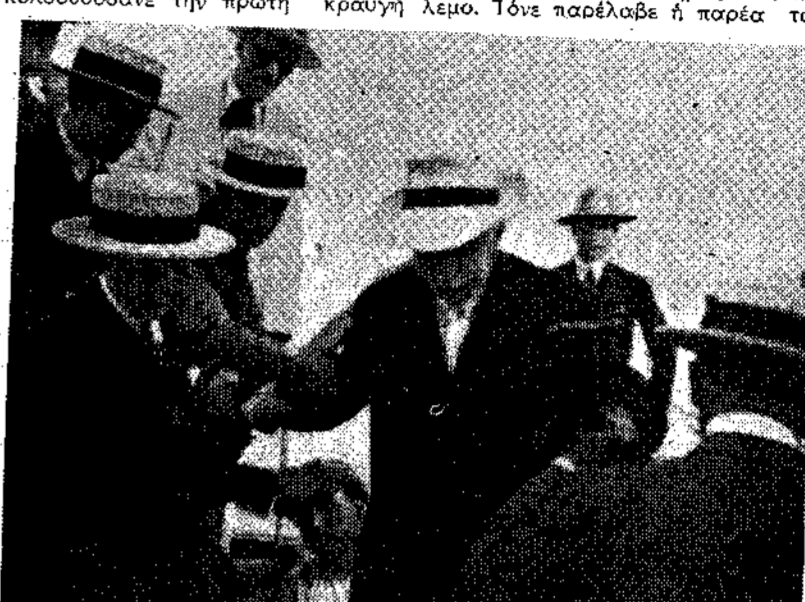
Ο Ψυχαρή βγαίνοντας στη Μυτιλήνη...