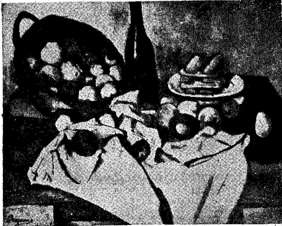
ΣΕΖΑΝ : «Άσπρη φύση».

Όσο κι αν κομμάτι φορά, ή φυλάκιση του σώματος δίνει περισσότερη έλευθερία στην ψυχή, ή παραπάνω Άνθολογία, που κυκλοφόρησε στην Άγγλια αυτό το μήνα, είναι έξαιρετικά χρήσιμη για να δεί κανείς την ψυχολογία των φυλακισμένων ανά τους αιώνας και είδικότερα των μορφωμένων κι άναπτυγμένων ανθρώπων που φυλακίστηκαν σε διάφορες έποχές, για πολιτικούς λόγους. Ο Προφήτης Ήρεμίας, ο Άγιος Παύλος, ή Μαρία Στούαρτ κι ο Ράλλεϋ, ο Μαχάτμα Γκάντι κ. ά. γεμίζουν τις ενδιαφέρουσες σελίδες αυτής της Άνθολογίας, άπό την όποια όμως, μπορεί να παρατηρήσει κανείς, πως λείπει, περίεργα, ή Άνθολογία του Σωκράτη.