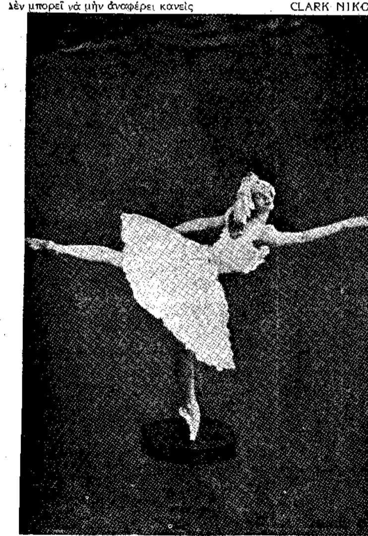
Η Παυλόφα σε μιά 'Αρρμασία.