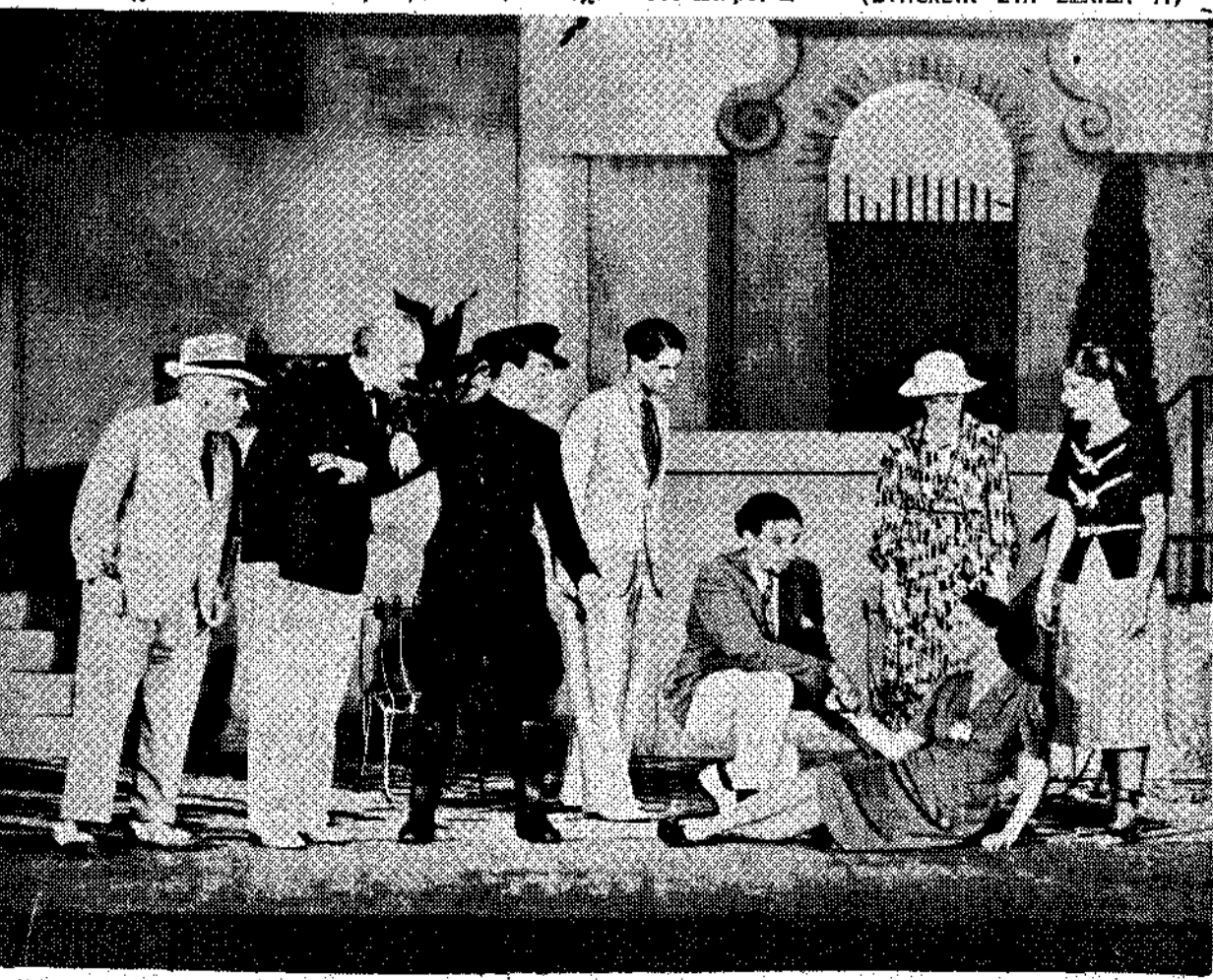
Μία σκηνή από τόν "Αμλετ", όπως τόν παρέραισε ο θάσος τού "Ολίβ Βικ".