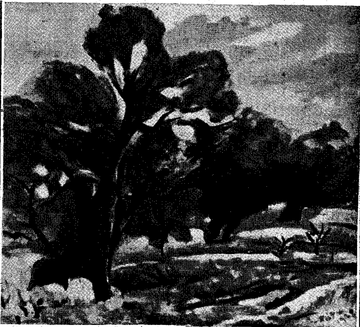
ΓΙΑΝΝΗ ΜΗΤΑΡΑΚΗ : «Τρεις ελιές»