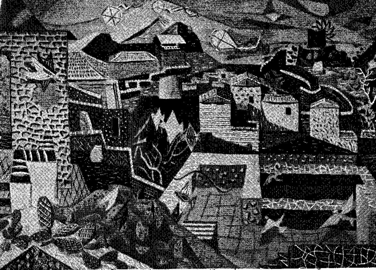
Η. ΚΑΤΖΗΚΥΡΙΑΚΟΥ - ΚΙΚΑ : «Τοπίο από νύκτα»