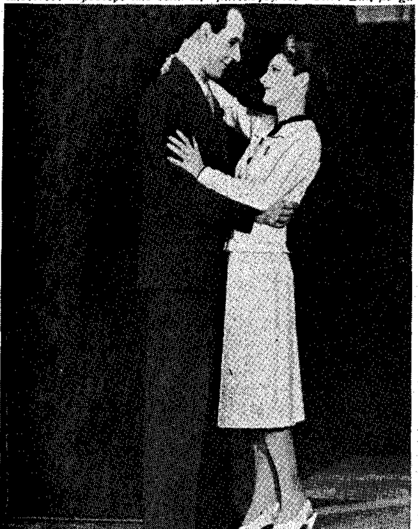
Μία σκηνή από τόν "Ανθώπος και Υπεράνθρωπος" τού Στ. Ο. Γουαντίου...