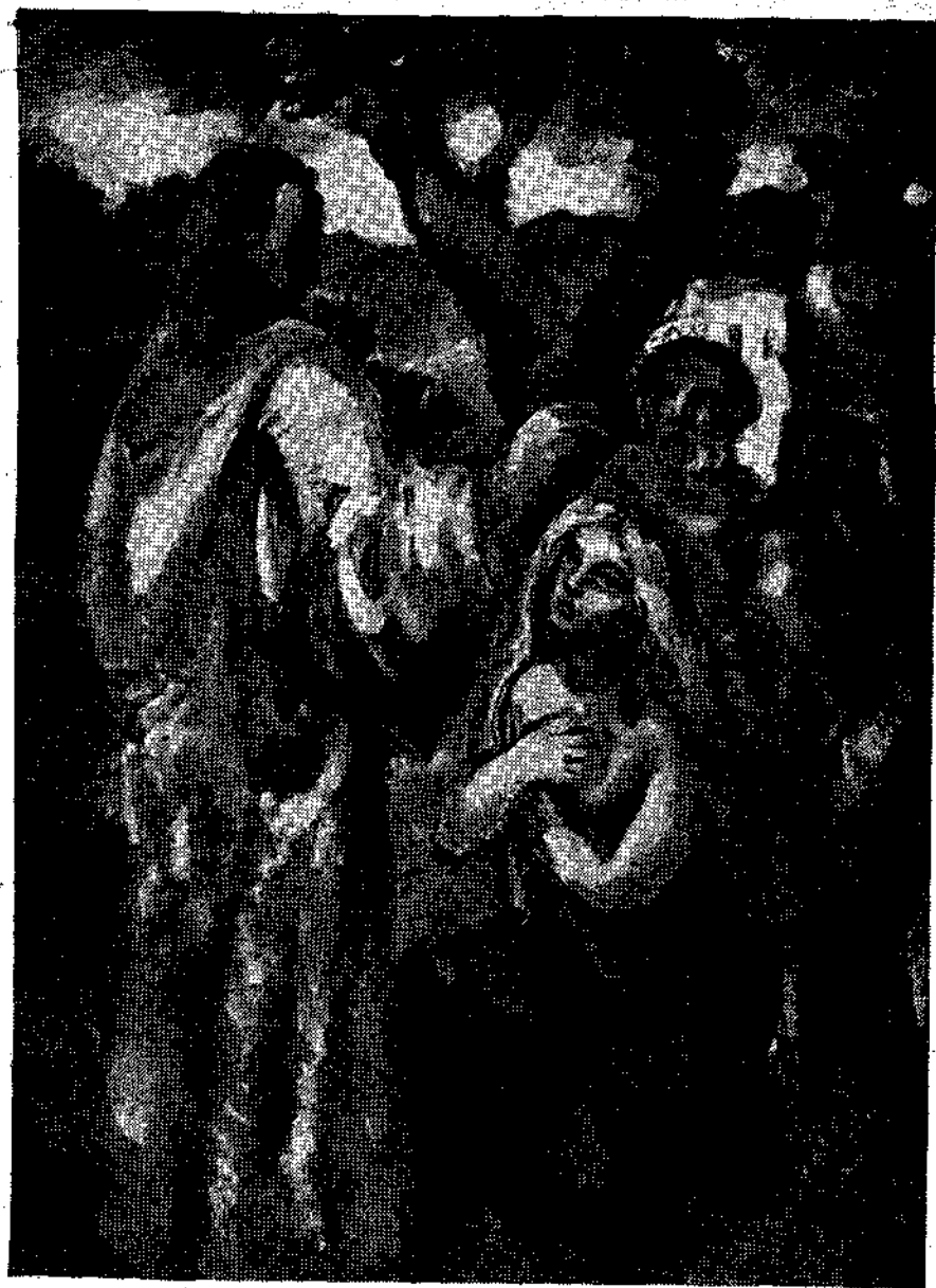
Α. ΒΙΤΣΩΡΗ : «Σύνθεση»