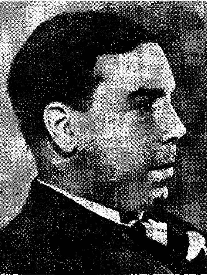
Μια τελευταία φωτογραφία του Πρίσλεϋ

το «Έχω ξαναέλθει σ' αυτόν τον τόπο» και το «Ο χρόνος και τα τρισάρατα». «Οι Άνθρωποι της Κρίσεως» είναι μια ακόμη τέτοια αλληγορία. Μας παρουσιάζει έναν όμιλο από συνηθισμένους ανθρώπους, τρεις άντρες και μια γυναίκα, που αντιπροσωπεύουν την αγνή και ήρεμη μερίδα της