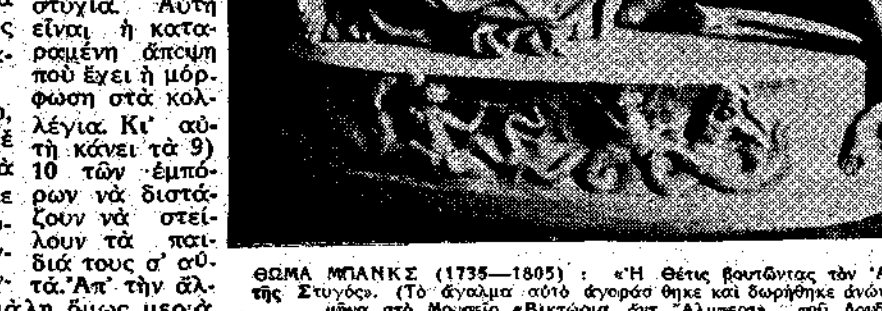
ΘΩΜΑΣ ΜΠΑΝΚΣ (1775—1805). «Η θύρα βουδίντας τον Άγγλο στα οστά της Στυγίας»...