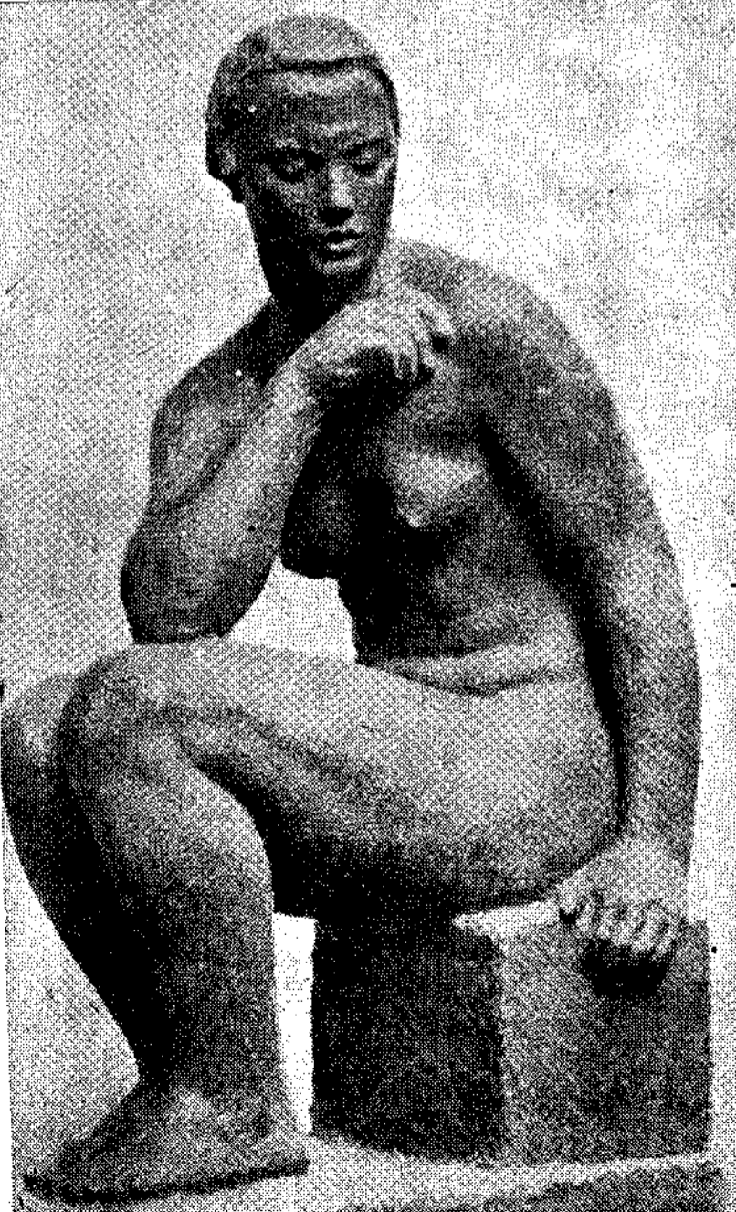
ΒΑΡΒΙΚ : «Γυμνός, μαρτυρικός».