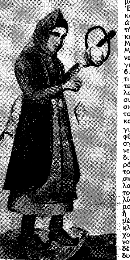
Φορεσιό απ' τα χωριά του κάμπο των Ίωαννίνων. (Σχέδιο του κ. Ν. Ξυγοπόλλου για τις Ήπειρώτικες Τέχνες.)

Έλληνες κλωσιόμενοι μοναχοί τους. Στά 70 χιλ. φαίνονται από μακρό ή έπι κακού. Το ποτάμι στο φλεβίζει απ' το Περιστέρι. Άλλοι το γράφουνε Άραχθο κι άλλοι Άνα- Πάιρνει κι ό πρωτομάστορας και ρίχνει μέγα λίθον. Άλλη ως μαγκιά: Τον ίσκιό της άρπάζουνε παίρνουν και τη στοιχειώνουν Κι' όσο κι πάει στο σπίτι της έπεσε του θανάτου. Όπως και τωρα μετρούνε μ' ένα ράμα το μιδί του άσθρούπου έπι καλού ή έπι κακού. Το ποτάμι του φλεβίζει απ' το Περιστέρι. Άλλοι το γράφουνε Άραχθο κι άλλοι Άνα-