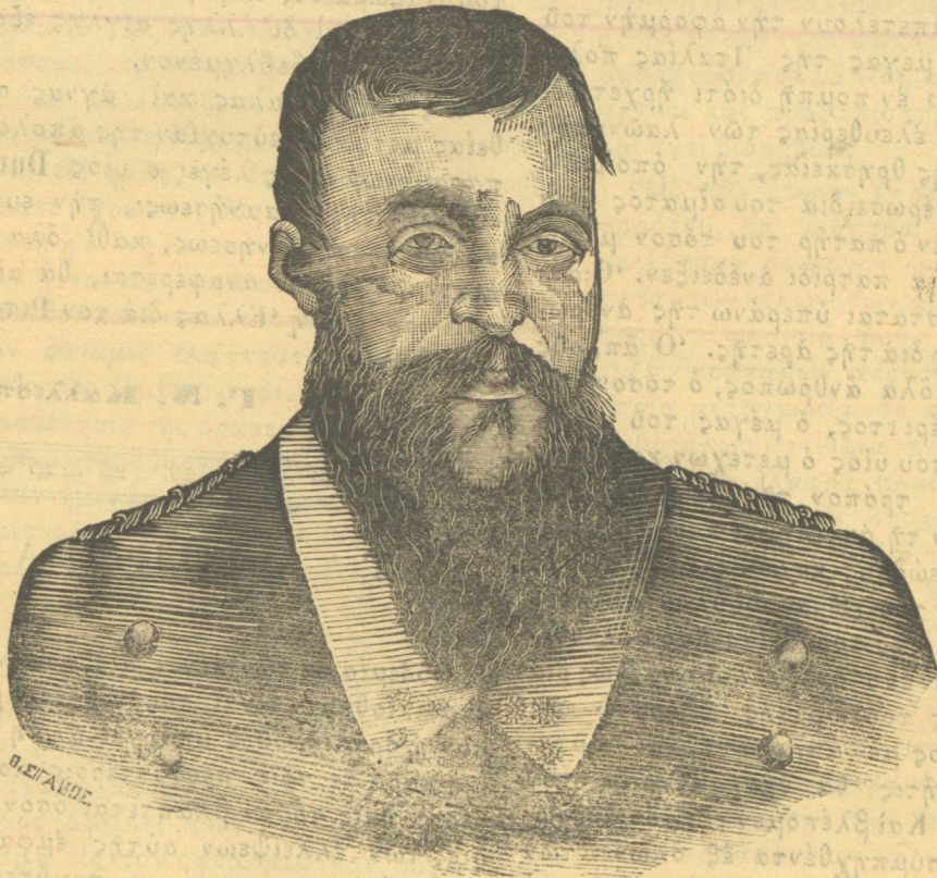
Ὁ στρατηγὸς Ρετσαϊώτης Γαριβάλδης.