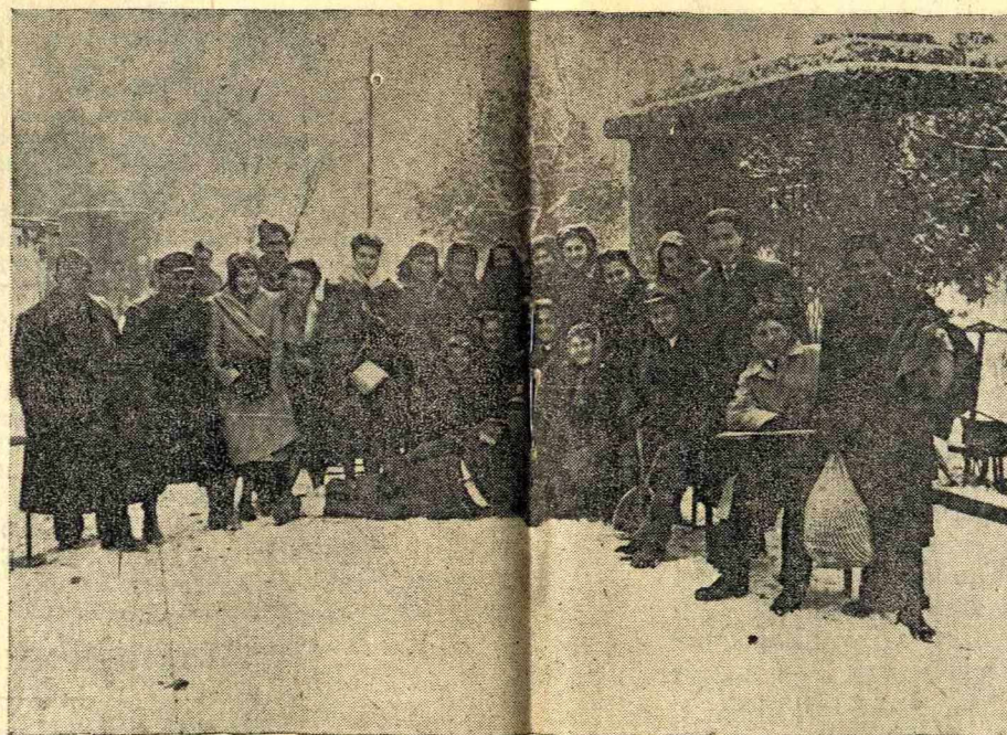
Ἡ «Ἑλληνοπούλα» Βορείου Ἑλλάδος καὶ οἱ ἀπόφοιτοι τοῦ Ε' Γυμνασίου ἀρρέων Θεσσαλονίκης ἐπαίξαν στὴ Βέροια γιὰ τὴν ψυχαγωγία τοῦ στρατοῦ μας τὸ ἔργο τοῦ Π. Καγιά «Τιμόνι στὸν Ἔρωτα» Εἰς τὴν φωτογραφίαν οἱ ἐρασιτέχναι μὲ τοὺς φανταράς μας.