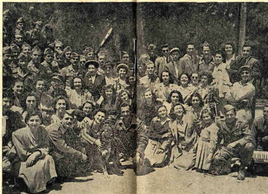
Ἡ «Ἑλληνοπούλα» κατόπιν προσκλήσεως Ἐπιτροπῆς κυριῶν τοῦ «Συνδέσμου Φίλων οὗ Στρατοῦ» ἐπεσκέφθη πρὸς ψυχαγωγίαν τὸ κέντρον ἐπιλογῆς ὑποψηφίων ἀξιωματικῶν. Εἰς τὴν εἰκόνα «Ἑλληνοπούλες μαζί με τοὺς μελλοντὰς ἀξιωματικούς μας.