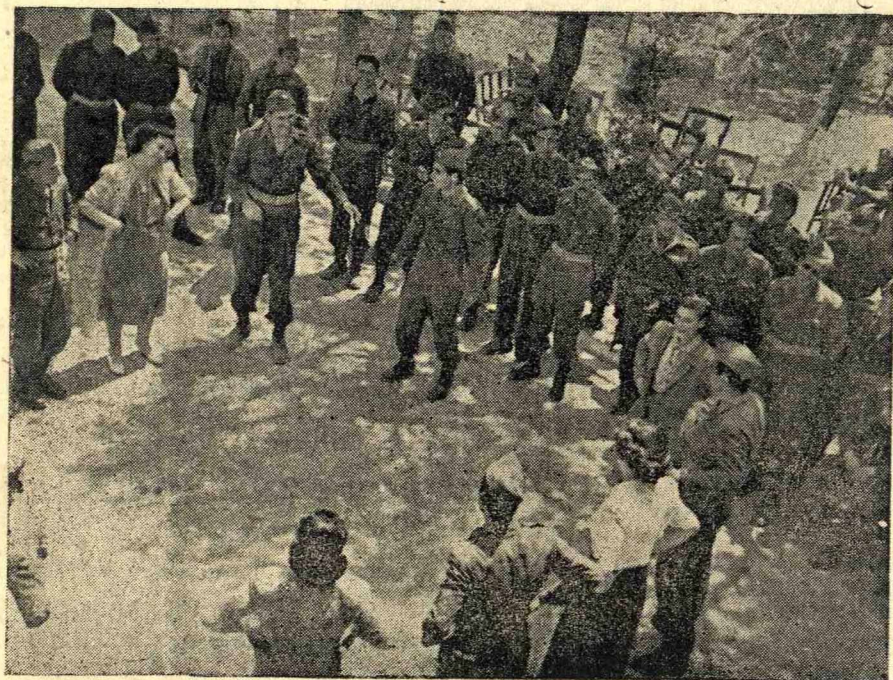
Τὰ μέλη τῆς «Ἑλληνοπούλας», ἀκούραστα καὶ μὲ πηγαῖον ἐνθουσιασμόν, τρέχουν παντοῦ ὅπου ὁ ἥρωϊκὸς στρατὸς μας εἴτε ἐκπαιδεύεται εἴτε πολεμᾷ, γιὰ νὰ τοῦ δώσουν ὅση χαρὰ μποροῦν. Ἀνωτέρω Ἑλληνοπούλες χορεύουν ἑλληνικοὺς χοροὺς εἰς τὸ Κ.Μ.Υ.Α.