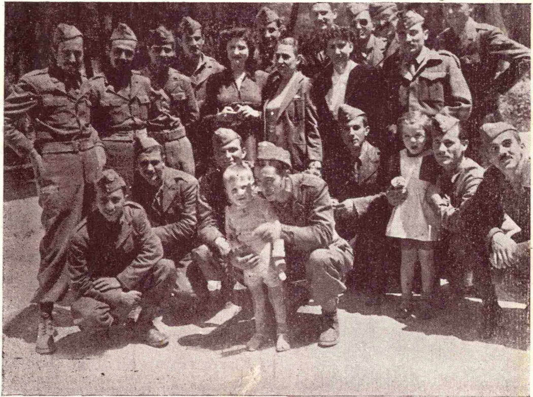
Ἐπίσκεψιν τῆς «ΕΛΛΗΝΟΠΟΥΛΑΣ» εἰς τό Κέντρον Ἐπιλογῆς Ἑπισηφίων Ἀξιωματικῶν