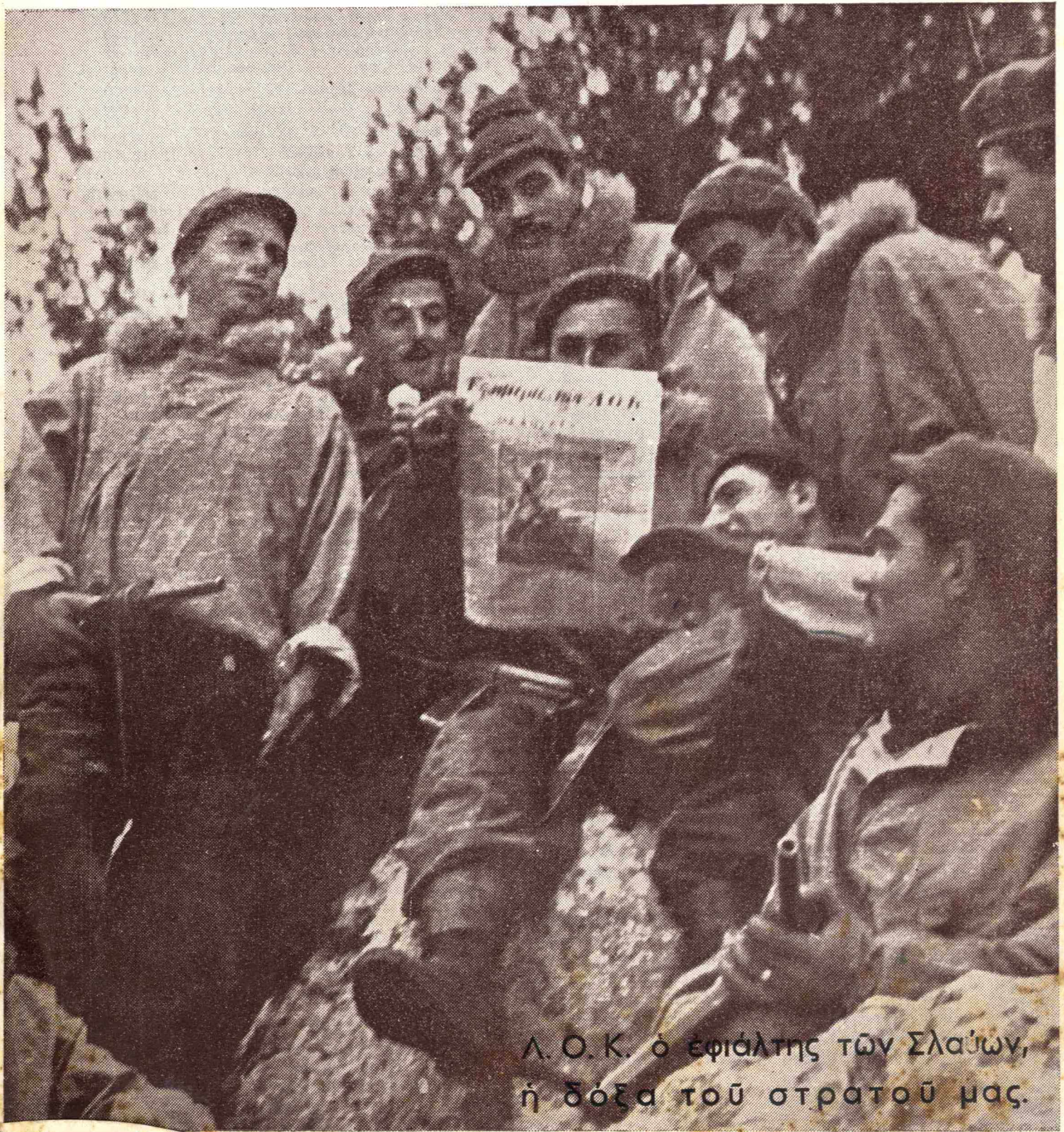
Α. Ο. Κ. ο έφιπλος των Σλαίων, ή δόξα του στρατού μας.