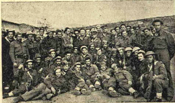
Ἡρωϊκοὶ ἀνώτατοι ἀξιωματικοὶ μὲ τοὺς στρατιώτας τῶν ὕστερα ἀπὸ μίαν ἐπιχείρησιν.

Δὲν εἶναι μόνον ἡ ἔνδοξος Ἐπανástασις τοῦ 1821 ποὺ ἔχει νὰ παρουσιάσει γυναῖκες ἡρωῖδες, γυναῖκες ποὺ νὰ ἐπολέμουν σὰν ἄνδρες δίπλα στοὺς συζύγους τῶν, τοὺς ἀδελφοὺς, οὕτως μόνον ἡ ἀρχαία Ἑλληνικὴ Ἱστορία τῶν ἀλλὰ ὁ νεώτερος ἡρωϊκὸς πόλεμος τῶν Ἑλλήνων κατὰ τῶν τριῶν κατακτητῶν.