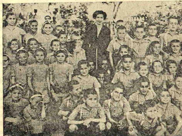
Η Α. Μ. ή Βασιλισσα ανάμεσα στα συμμοριόπληκτα.

Στη φωνή τους μην αδρανούμε. Πολλά απ' αυτά κατώρθωσαν κι' έστειλαν κρυφά μηνύματα στους δικούς τους περιγράφοντας τη φρικτή ζωή τους. Άλλα πάλι κατώρθωσαν με χίλιους κινδύνους να δραπέτεύσουν για να ξανάρθουν κοντά μας κι' άλλα βρίσκουν το θάνατο απ' τους κόκκινους δολοφόνους γιατί έχουν το θάρρος να ύψωσουν την ελληνική φωνή.