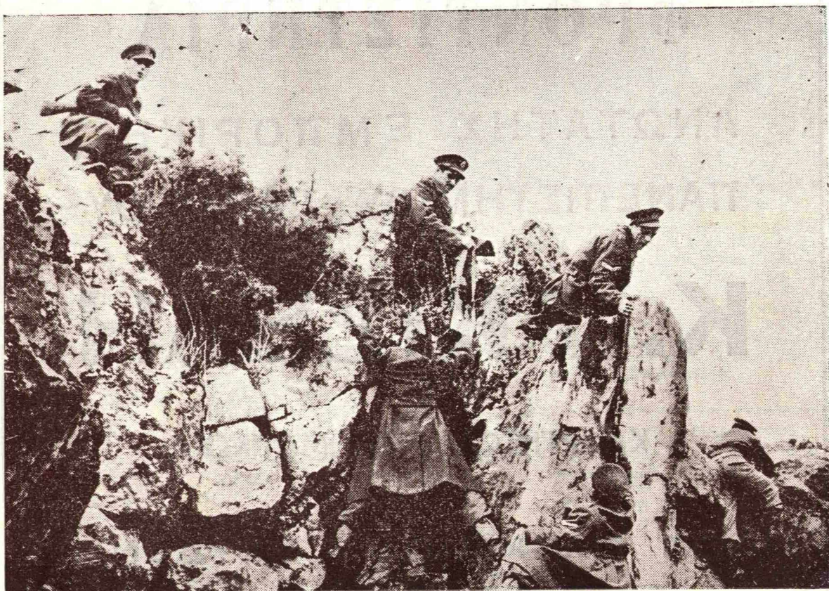
Οι άγριτοι φρουροί του πατρίου έδάφους.