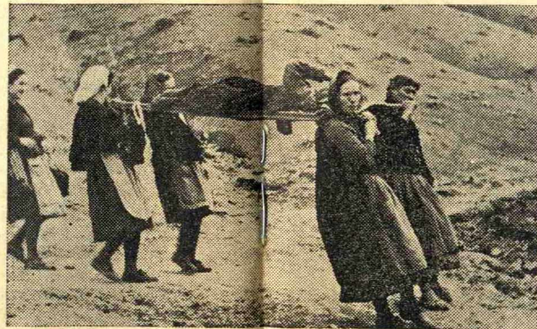
Λεβεντογυναῖκες τοῦ Γράμμου μεταφέρουσαι ἡρώως τραυματίαν.

Στὸ ἀναμεταξὺ τὰ «χωνιά» τῶν σλαύων ἔδιναν καὶ ἔπαιρναν. Δὲν μποροῦσαν νὰ τὸ χωνέψουν πὼς οἱ χωροφύλακες ἄντεχαν ἀκόμη. Γι' αὐτοὺς, τοὺς αἰσχροὺς προδότας, ἡ ἐπιταγὴ ἦτο μιά: Νὰ καταληφθῆ ἡ Χαλανδρίτσα. Βεβαίως τὰ ἀργύρια τῆς προδοσίας εἶναι πολλά, ἀλλὰ καὶ ἡ τιμωρία τῆς ἀποτυχίας ἦτο φοβερῆ. Ἡξεραν καλὰ πὼς τοὺς περιέμενε τὸ «ἀνταρτοδικεῖον». Γι' αὐτὸ πολεμοῦσαν σὰν λυσσασμένοι ἀδίστακτα, οἱ ἀρχηγοὶ ἔριπταν τοὺς ἄνδρας κατὰ μπουλούκια ἐπάνω στὰ φυλάκια τῶν ὑπερασπιστῶν τῆς Χαλανδρίτσας. Ἀδιαφοροῦσαν γιὰ τὴ ζωὴ τῶν συνανθρώπων τους. Ἐπρεπε νὰ νικήσουν. Ἡδῶλλως... Μὲ προτροπές, μὲ φοβέρες, μὲ ὑποσχέσεις παρώτρυναν τοὺς ἄνδρας τοὺς κατσαπλιάδες: «Συναγωνιστῆς ντροπὴ μας, πρέπει νὰ τσακίσουμε τοὺς μοναρχοφασίστες», ἔσκουζαν τὰ χωνιά, προσπαθώντας νὰ λιγύσουν καὶ τὸ ἠθικὸ τῶν ἡρωϊκῶν ὑπερασπιστῶν τῆς Χαλανδρίτσας. Αὐτοὶ ὅμως δὲν ἐτρόμαζαν ἀπὸ κάτι τέτοια. Δὲν ἦτο ἡ πρώτη φορὰ ποὺ ἔλεγαν τὸ ὄχι στὸν ἐχθρὸ. Καὶ στίς προκλήσεις τῶν χωνιῶν ἀπαντοῦσαν μὲ τὸ ἀθάνατο Ἑλληνικὸ σύνθημα «ἄερα», «ἄερα βούλγαροι, ἡ Ἑλλάδα ποτὲ δὲν πεθαίνει».