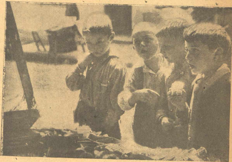
Κοπιάζουν τόσο πολὺ οἱ μικροὶ μαθηταὶ σ' ἄλλα μέρη γὰρ νὰ ἀποστηθίσουν τὸ μητρικὸ τους ἀλφάβητον.

Μὰ τὸ πῶς κακὸ εἶνε ὅτι στὴν ἀραβικὴ γλῶσσα τὰ φωνήεντα παραλείπονται. Ἡ λέξις ἀποτελοῦνται δηλαδὴ μόνον ἀπὸ σύμφωνα καὶ γὰρ νὰ τὶς διαβάσῃ κανεὶς πρέπει νὰ μαντεύσῃ τὰ φωνήεντα ποῦ βρισκονται ἀνάμεσά τους.