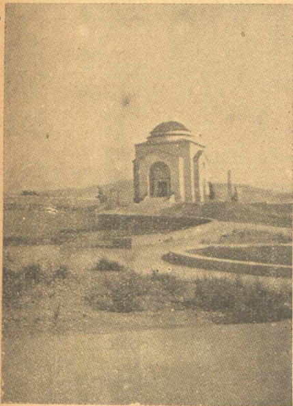
Ἡ ΓΡΑΦΙΚΗ ΕΚΚΛΗΣΙΑ ΤΟΥ ΑΡΣΑΚΕΙΟΥ,

Ὅταν τὴν ἄλλη μέρα μέσα στὸν καθαρὸ θάλαμο τοῦ στρατιωτικοῦ νοσοκομείου συνῆλθε ἀπὸ τὸν κλονισμό ποῦ εἶχε πάθῃ μὲ δάκρυα στὰ μάτια ἄκουε γὰρ τοῦ λένε, πὼς χάρις σ' αὐτὸν, χάρις στὸ θᾶρρος ποῦ εἶχε δείξει, οἱ συμπατριῶτες του εἶχαν σωθῆ ἀπὸ βέβαιο θάνατο καὶ τὰ ἐχθρικά στρατεύματα εἶχαν ἀναγκασθῆ γὰρ ὑποχωρήσουν.