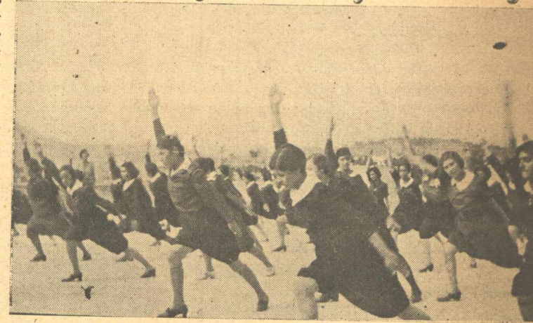
Ἡ Μαθήτριες τὴν ὥρα τῆς Γυμναστικῆς

Γι' αὐτὸ ἡ γυμναστική καὶ ὅλα τὰ παιχνίδια πού δίνουν τὴν χαρὰ στο σῶμα καὶ στὴν ψυχὴ ἔχουν σπουδαῖο μέρος στὴν ἐκπαίδευσιν τῶν Ἀρσακιάδων. Ἡ γυμναστική γίνεται πότε σὲ ἓνα γῶρον μέσα στὰ πεῦκα πότε στὸ γυμναστήριον μὲ τὰ μονόζυγα καὶ τὰ δίζυγα, πότε στὶς ἀπέραντες ταράτσες τοῦ σχολεῖου. Γιὰ ὅσα παιδιά ἔχουν ἀνάγκη ἀπὸ ὀρθοπεδικὴ γυμναστικὴ τὸ σχολεῖο ἔχει κάμει ἐγκατάστασι ἀπὸ εἰδικὰ ὀρθοπεδικὰ ὄργανα!