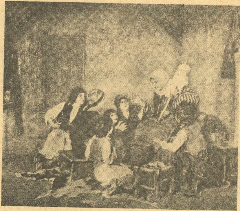
ΤΟ ΠΑΡΑΜΥΘΙ ΤΗΣ ΓΙΑΓΙΑΣ