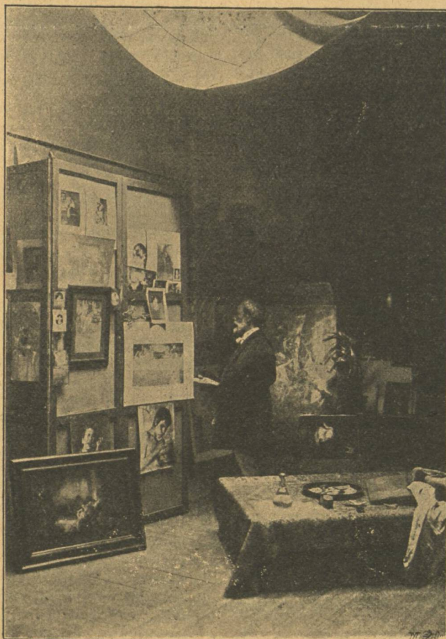
Ἐργαστήριον Ν. Γύζη.

ἐν ἄκρον ἐγένετο μὰ θηλειὰ καὶ τὸ ἄλλο ἄκρον ἔρριψαν εἰς ἓνα δοκόν, ὃ ὁποῖος ἦτο ὑπεράνω των. Τότε, ἂν καὶ ἡ κόρη ἐξεφώνει καὶ ἠγωνίζετο, ὃ σιδηροργὸς ἔβαλε τὰ χεῖρα της εἰς τὸ ἰδικόν του καὶ μὲ τὸ ἄλλο ἐπίεσε τὴν θηλειάν περὶ τὸν λαιμόν της. Οἱ ἄνδρες σχεδὸν ἡμιθανῆ τὴν ἔσυραν εἰς τοὺς πόδας της, ἐνῶ αὐτὴ ἐξηκολούθει νὰ κλαίῃ, νὰ ἀνθίσταται καὶ νὰ ἀποδιώκῃ μαριωδῶς τὸ σχοινίον, ὅπερ ἤρριψε νὰ τὴν σφίγγῃ. Μετὰ μίαν στιγμὴν ἡ Μαρία θὰ ἐσπάρασσεν εἰς τὸν ἄερα. Αἴφνης ἡ θύρα τῆς σκευοθήκης ἠνοιχθή καὶ μία καθαρά, ἠχητικὴ φωνὴ διέταξεν αὐτοὺς νὰ σταματήσωσιν. Οἱ ἄνδρες ἐστράφησαν γύρω των ἐν ἐκστάσει. Πρὸ αὐτῶν ἴστατο ὁ Ὑποκόμης τῆς Τρονβίλλης μὲ τὸ ἔτιφος εἰς τὴν χεῖρα.