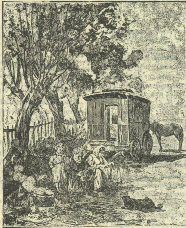
Ἐπεδιώρθωνον εἰς τὴν σκιάν τῶν πετελῶν. . . (Σελ. 6)

Εἶναι ἡ μοναδικωτέρα, ἢ συγκλητικωτέρα ἴστο